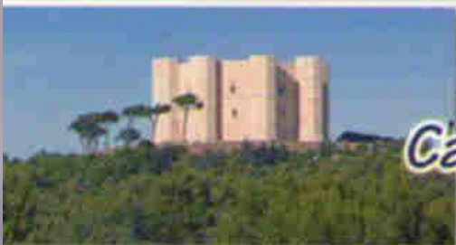
Castel del Monte