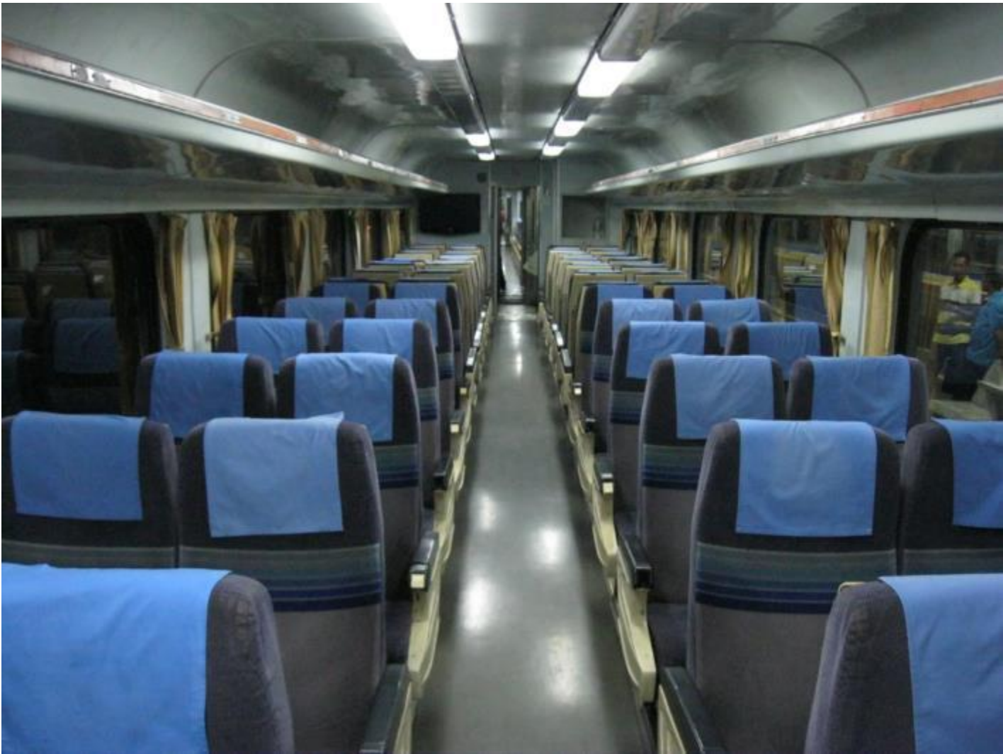
Вагон с сидячими местами.