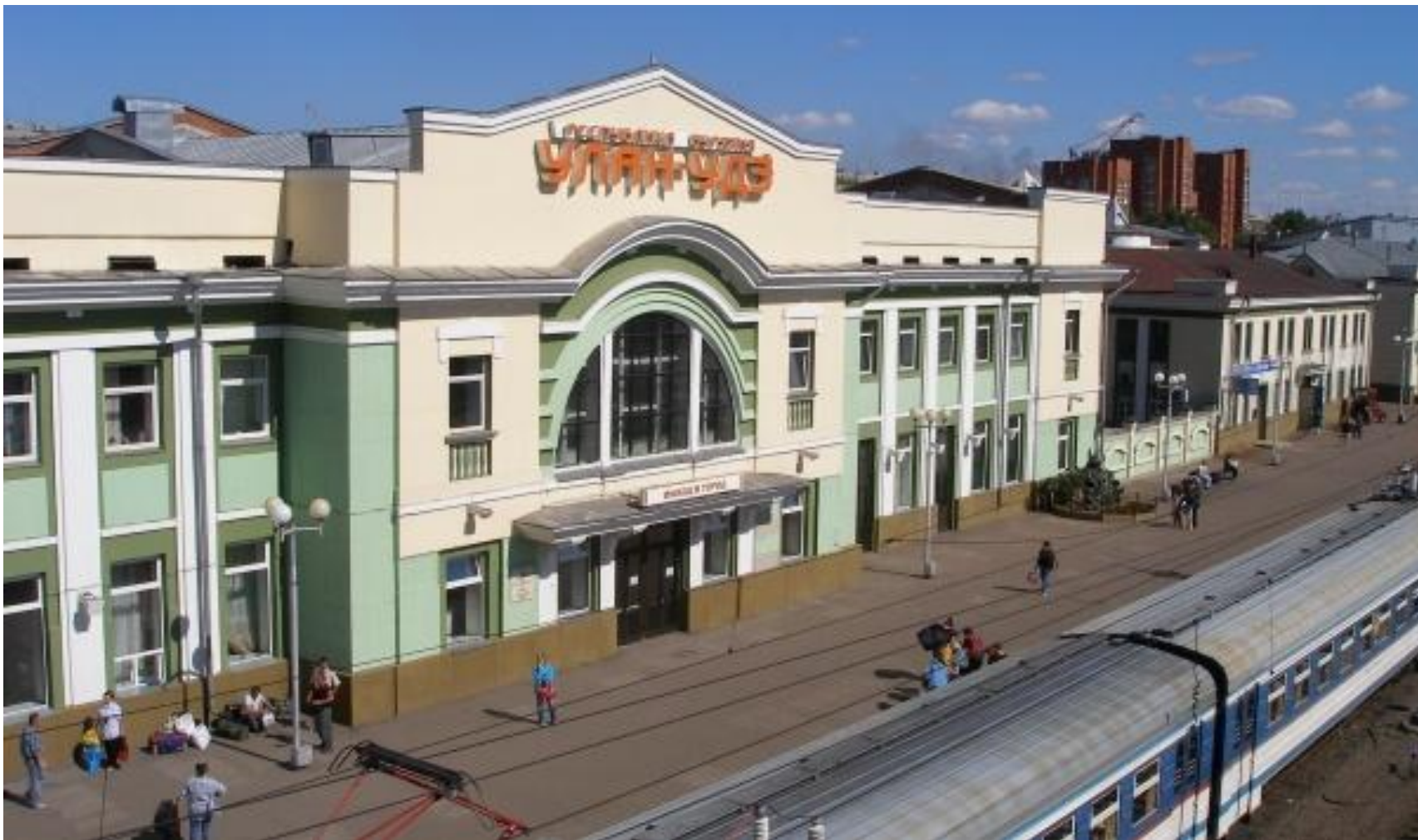
Это железнодорожный вокзал. Здесь пассажиры садятся на поезд.