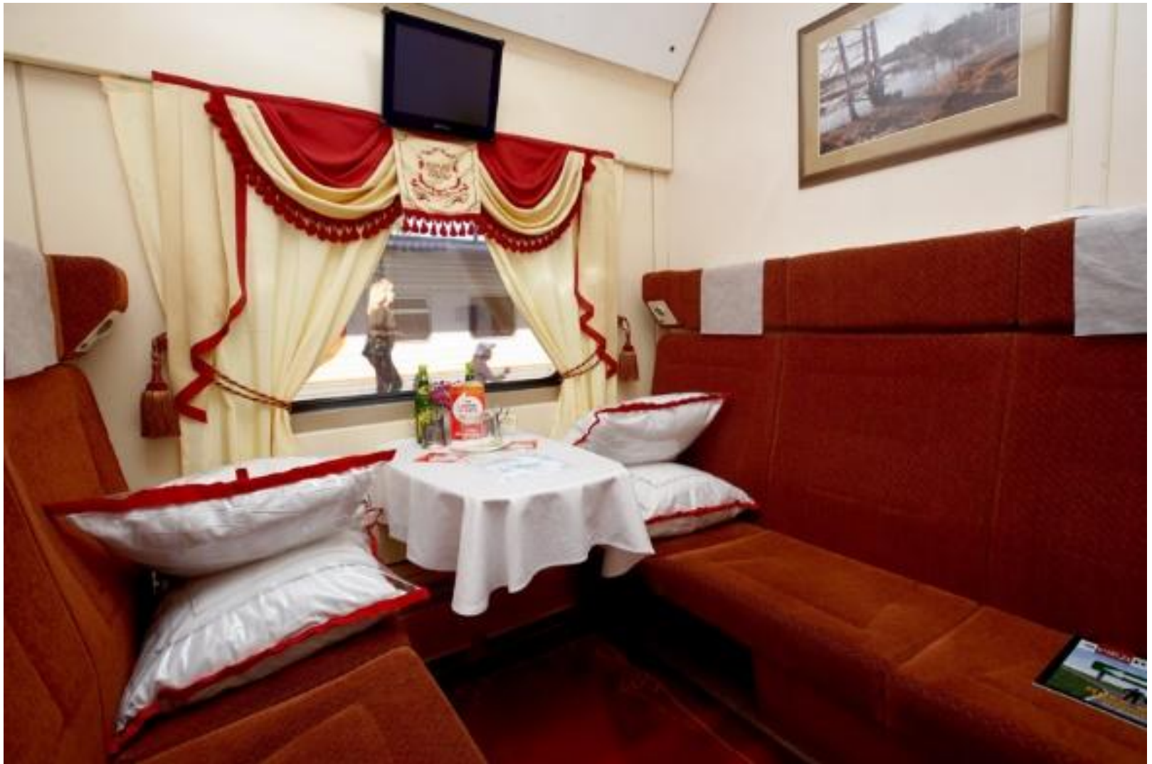
Вагон повышенного комфорта