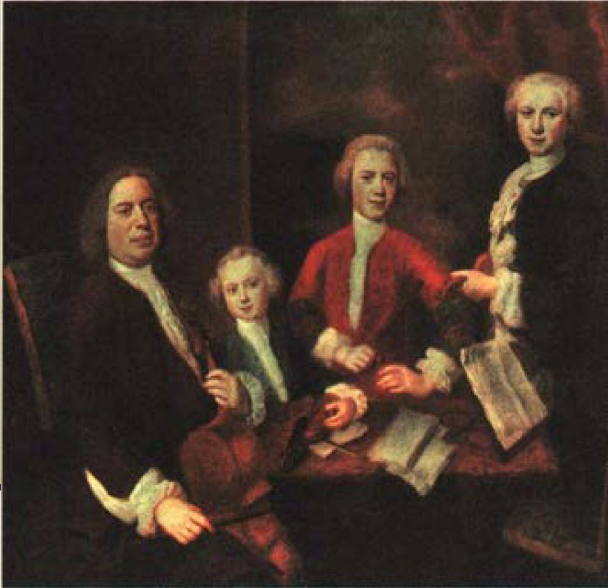
Б. Деппис. Портрет Баха с тремя сыновьями. 1730 г. Архив центра культуры, Бранденбург

Бах любил импровизировать за клавесином на темы популярных песен, сочиня изящные и лёгкие сюиты, состоящие из немецких (аллеманда), французских (куранта), испанских (сарабанда) и английских (жига) танцев. Французские и Английские сюиты стали подлинным украшением концертных программ .