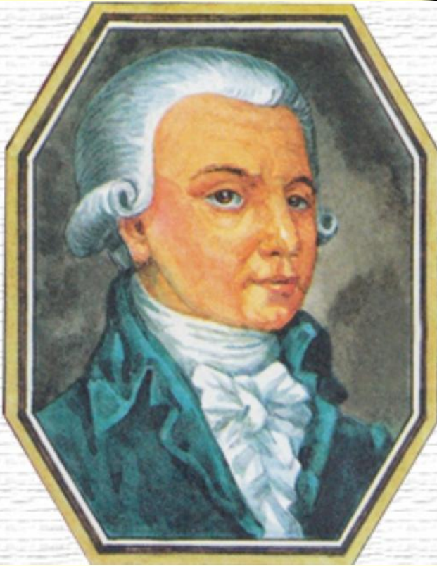
Максим Созонтович Березовский (1745- 1777), русский композитор, певец (бас), один из основоположников русской хоровой классики.