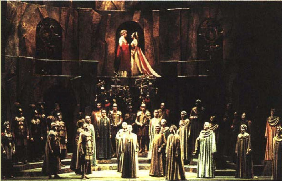
Сцена из оперы К. Монтеверди «Коронация Поппеи». Постановка Цюрихской оперы. 1975 г.

Лучшие оперы Монтеверди: «Орфей» (1607), «Коронация Поппеи» (1642), созданные на мифологические и исторические темы, отличаются богатством и занимательностью сюжета .