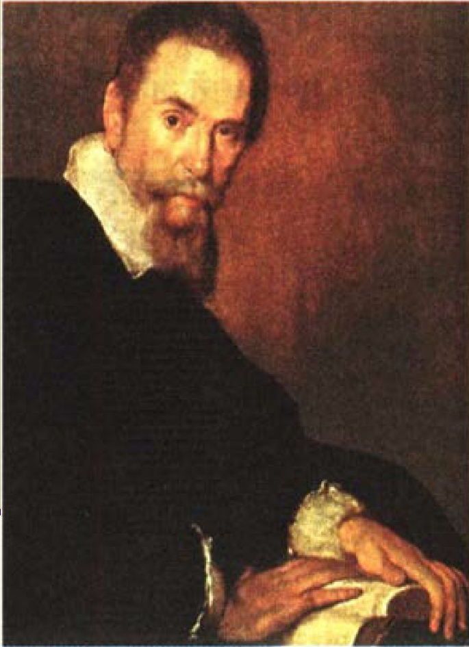
Б. Строчи. Портрет К. Монтеверди. Ок. 1640 г. Общество друзей музыки, Вена

Клаудио Монтеверди (1567-1643) - первый оперный композитор барокко и блестящий реформатор этого жанра. Он углубил содержательный смысл оперы, расширил выразительные средства и формы вокальных и оркестровых партий , ввёл в неё увертюру и дуэт . Главным его новшеством стал «ВЗВОЛНОВАННЫЙ СТИЛЬ» (concitato) , передающий драматизм и напряжённость действия, глубину страстных человеческих чувств и переживаний, создал мелодию, сочетающую в себе речевые интонации, декламацию и вокал. Он обогатил оперу полифонической традицией средствами музыки показал многообразие и противоречивость человеческих характеров.