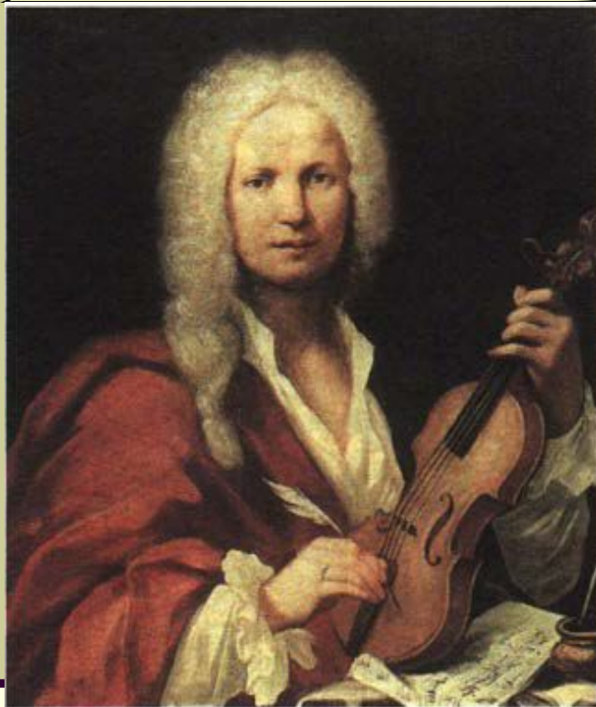
Ф. М. Каово. Портрет А. Вивальди. Сборник концертов Вивальди. 1723 г.

Антонио Вивальди (1678-1741) - автор 465 (!) концертов и 40 опер, блестящий скрипач-виртуоз, выдающийся мастер барочного концерта «взволнованного стиля».