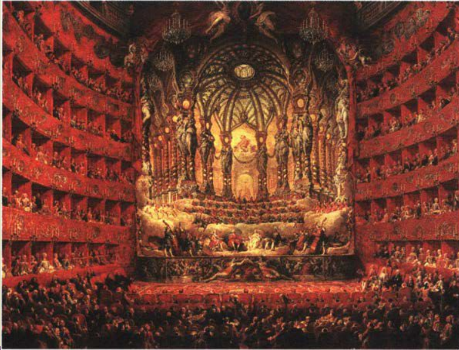
Д. Папи. Музыкальное представление. Ок. 1729 г.

Музыкальная культура барокко существенно отличалась от музыки Возрождения. В ней царило ощущение неизбежности перемен и дух новаторства. Один из меломанов начала XVII в. с возмущением писал: «Музыкантам хочется изобретать нечто новое . И вот новое искусство докатилось до безудержной распущенности. Отклонившись от путей, намеченных нашими отцами, молодые композиторы создают искажённые произведения, в которых нет никаких достоинств, кроме новизны...»