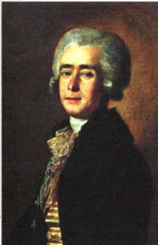
М. И. Бельский. Портрет композитора Д. С. Бортнянского. 1788 г. Государственная Третьяковская галерея, Москва

Призванным мастером духовного хорового концерта по праву считают Дмитрия Степановича Бортнянского (1751-1825). В историю русской музыки он вошёл прежде всего как автор 35 хоровых духовных композиций для четырёхголосного хора, 10 концертов для двух хоров. Одним из лучших сочинений Бортнянского был концерт № 32 «Скажи ми, Господи, кончину мою...», созданный на слова 38-го псалма Давида. П. И. Чайковский, редактировавший в 1882 г. сочинения Бортнянского, считал этот концерт лучшим.