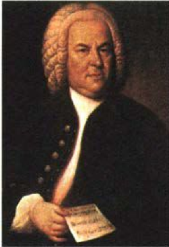
Э. Г. Хаусмап. Портрет И. С. Баха. 1746 г. Музей истории города, Лейпциг

Иоганн Себастьян Бах (1685-1750) - немецкий композитор барокко, органист. Один из наиболее известных композиторов мира.