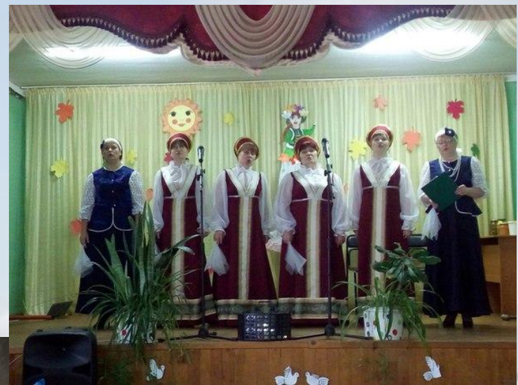
Фольклорный ансамбль русской песни «Задоринка»