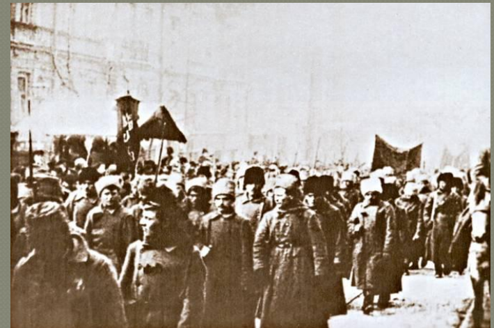
Більшовицьке військо входить у Київ. 5 лютого 1919 р.

Директорія переїздить до Вінниці, а потім до Кам' янця- Подільського.