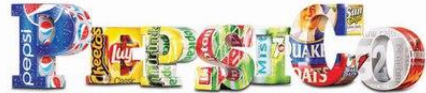
Всемирный кодекс поведения