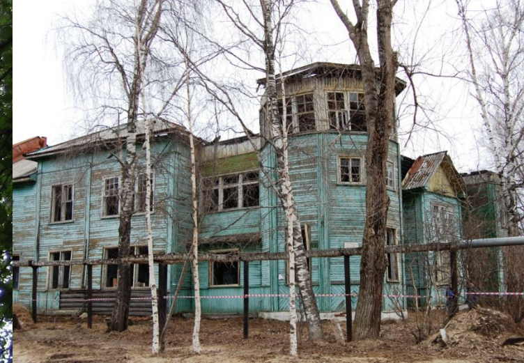
Здание 13 школы в г. Сыктывкар

В 2018 г. исполняется 105 лет зданию Вильгортского начального земского училища, возведенному по проекту первого коми архитектора Александра Викентьевича Холопова (единственное сохранившееся здание архитектора)!