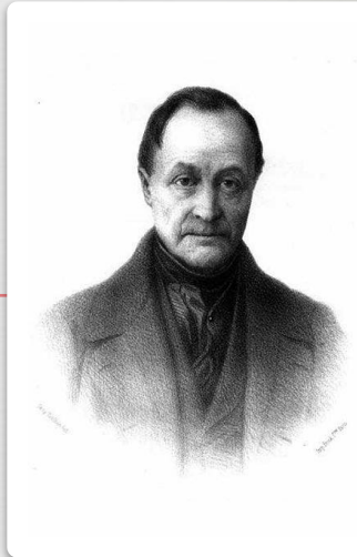
Огюст Конт (1789-1857), основатель социологии

На третьей позитивной или научной стадии , для которой характерна тесная связь всякого знания с опытом, человек довольствуется тем, что благодаря наблюдению и эксперименту осуществляет сбор и накопление фактов в соответствии с системой, которая не проникает в сущность вещей, а описывать закономерности процессов.