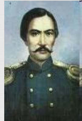
Чокан Валиханов в 1835-1865