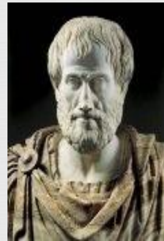
Аристотель 384-322 вв. до н. э.