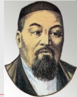
Абай Кунанбаев в 1845-1904