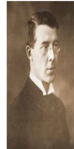
Пити́рим Алекса́ндрович Соро́кин

□ Предмет социологии , по мнению П.Сорокина, – социальное поведение и деятельность людей, социальных групп и структуры общества в целом.