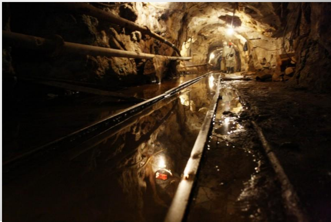
Шахта Южная г. Воркута

Шахта – горное предприятие, предназначенное для добычи полезных ископаемых подземным способом.