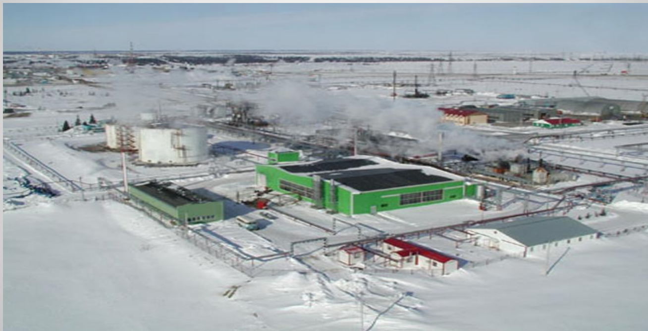
ОАО Лукойл- ТПП Усинск нефтегаз г. Усинск (Р. Коми)

Промысел – горное предприятие по добыче жидких и газообразных полезных ископаемых.