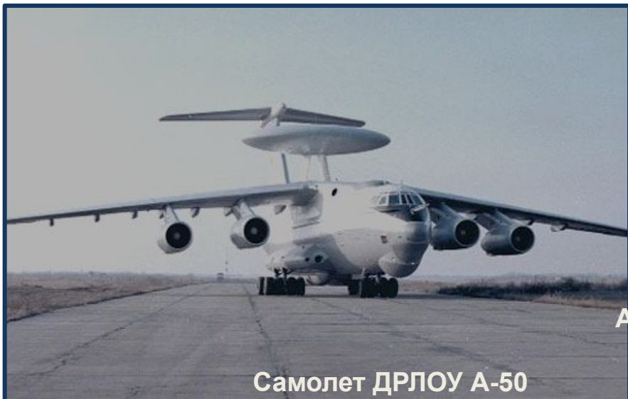
Самолет ДРЛОУ А-50