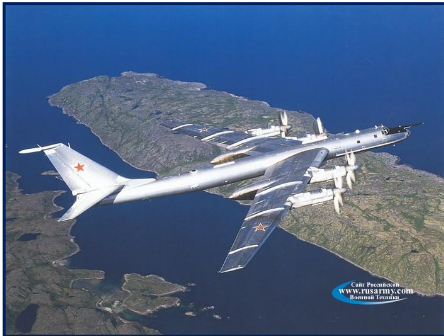
Ту - 95 МС