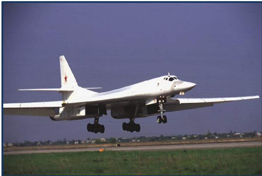
Ту - 160