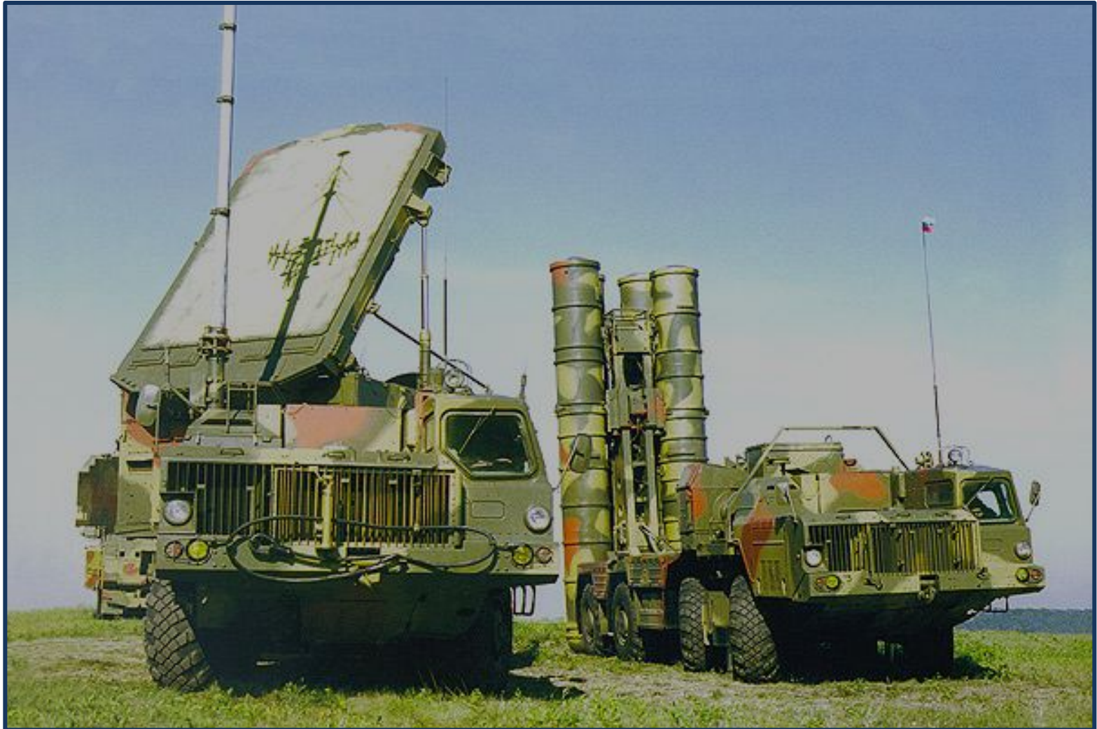
Зенитная ракетная система С-300 ПМ