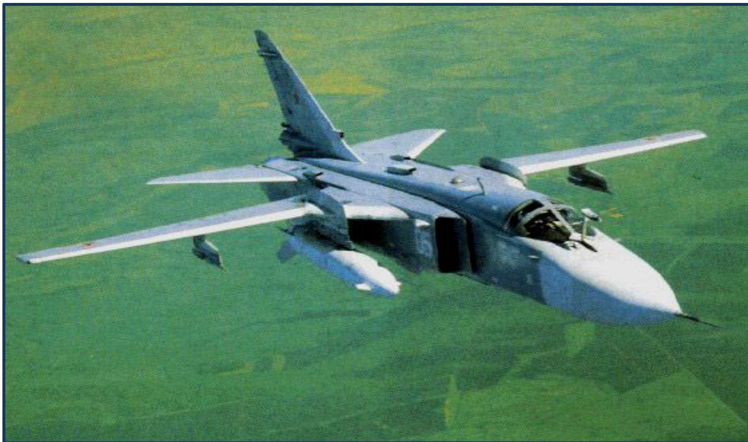
Фронтальной бомбардировщик СУ-24 М