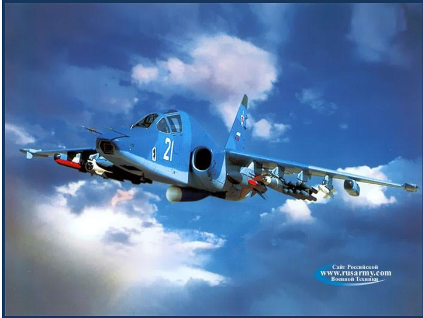
Су - 25