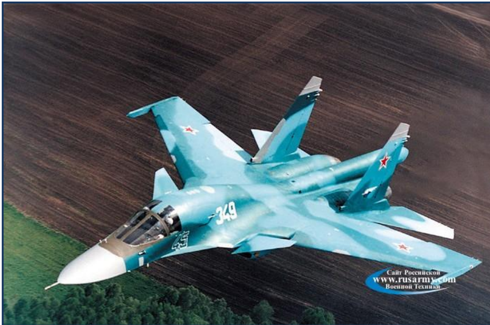
Су - 30