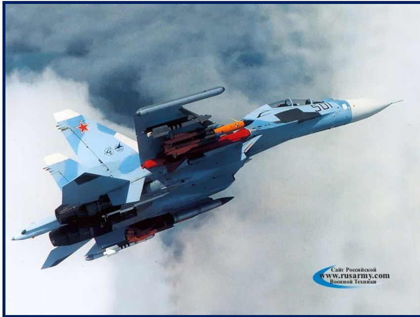
Су - 27