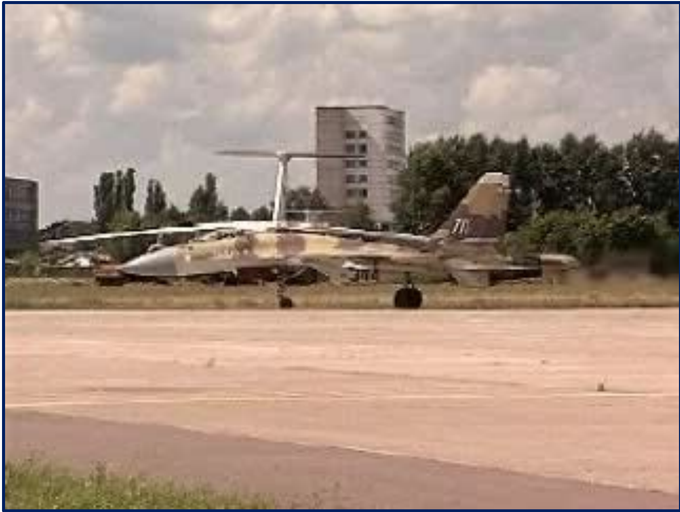
Cy - 27