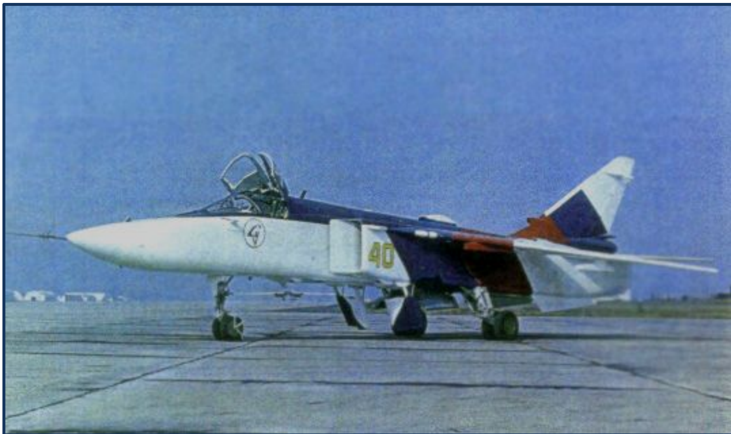
Самолет –разведчик СУ-24МР