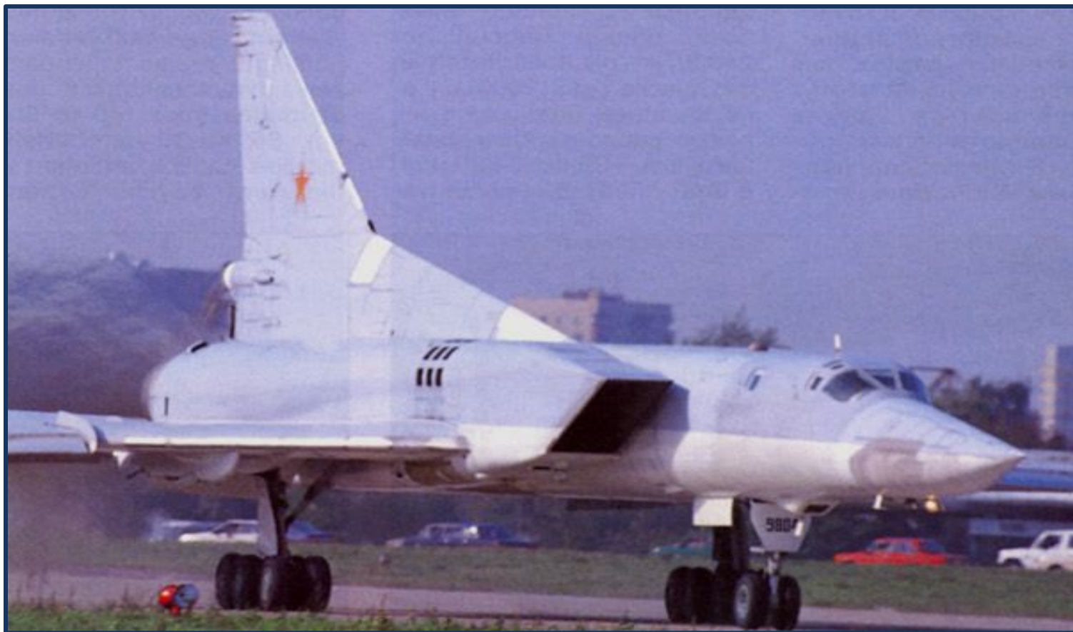
Дальний бомбардировщик ТУ-22М3