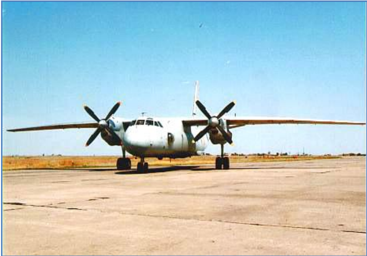
Ан – 26