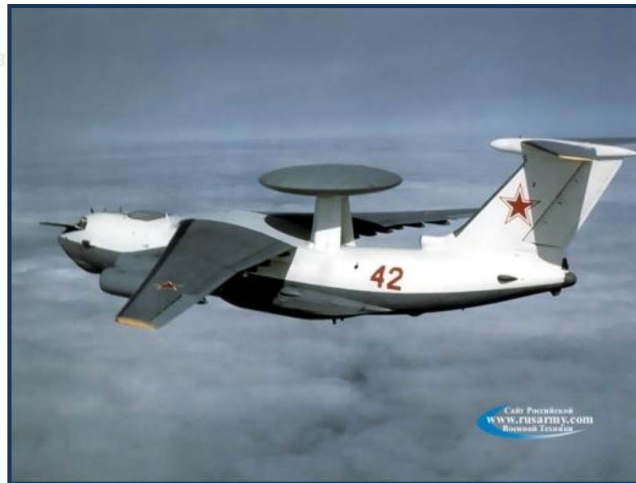
Самолет ДРЛОУ А-50