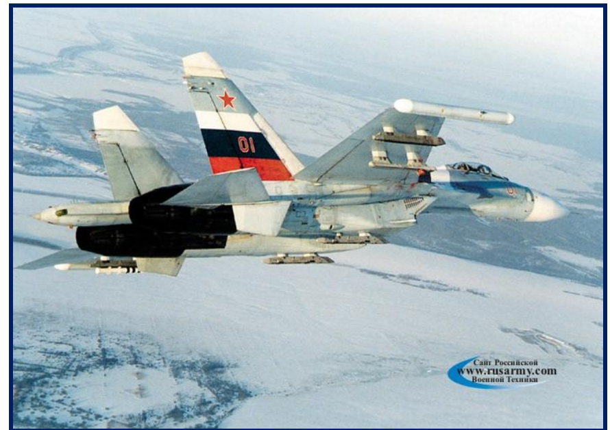
Су - 27