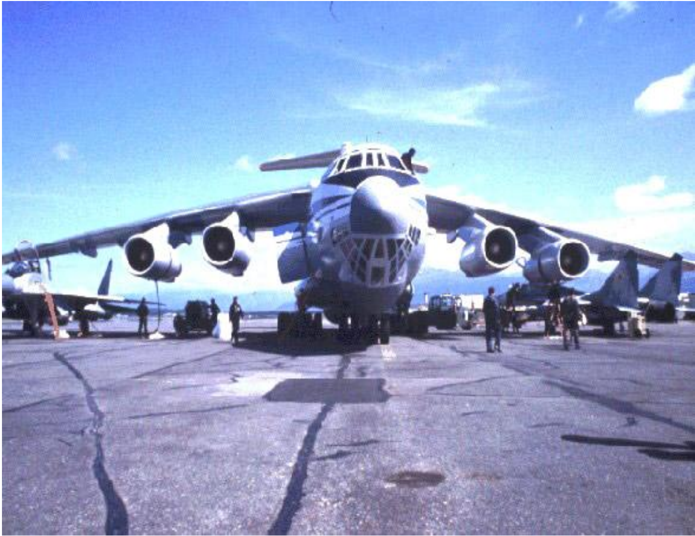
Ил - 76