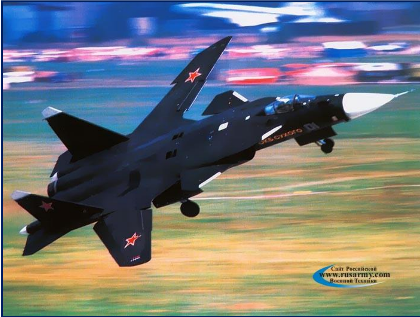
Су – 35 «Беркут»