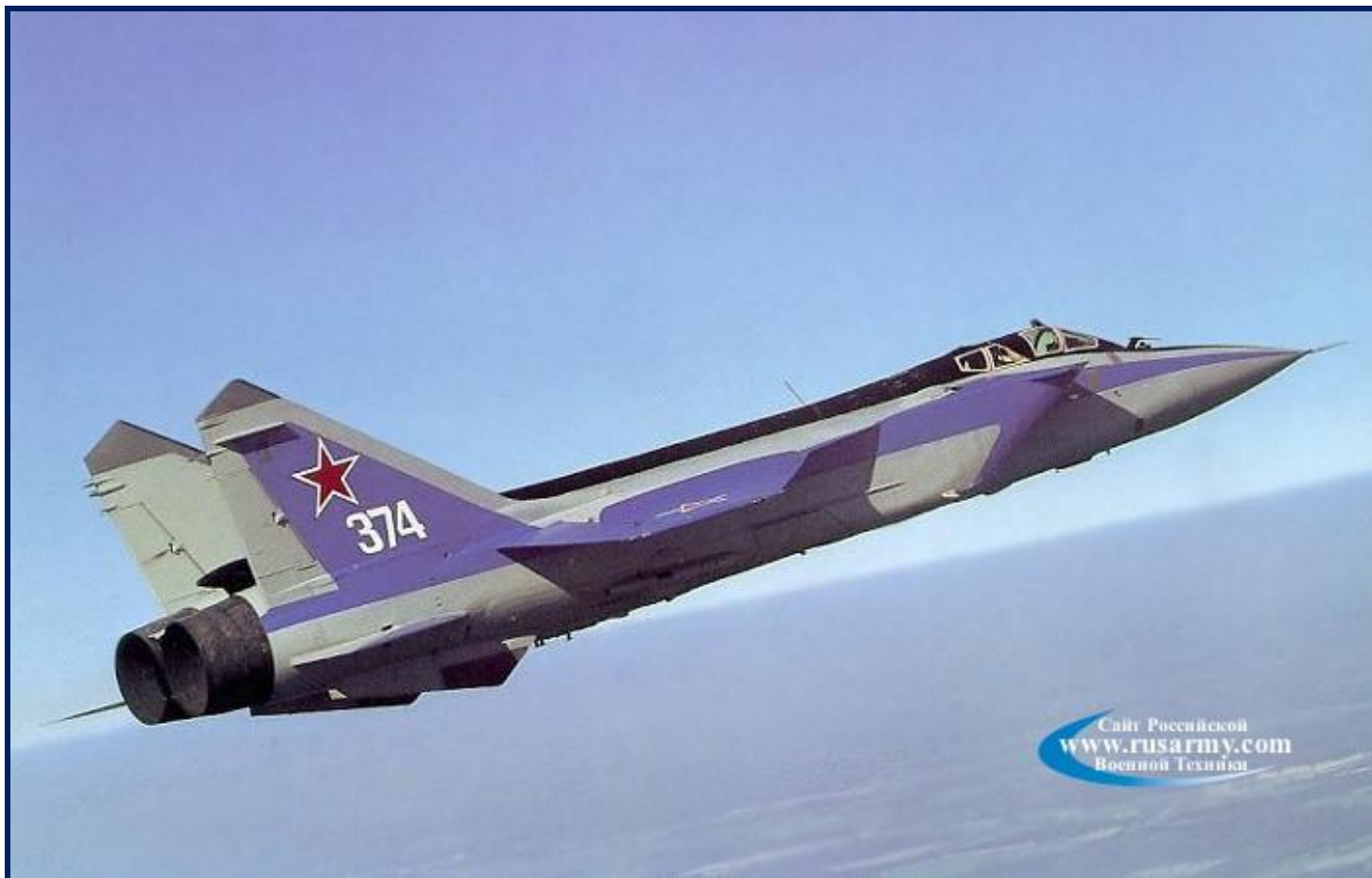
дальний перехватчик МиГ - 31