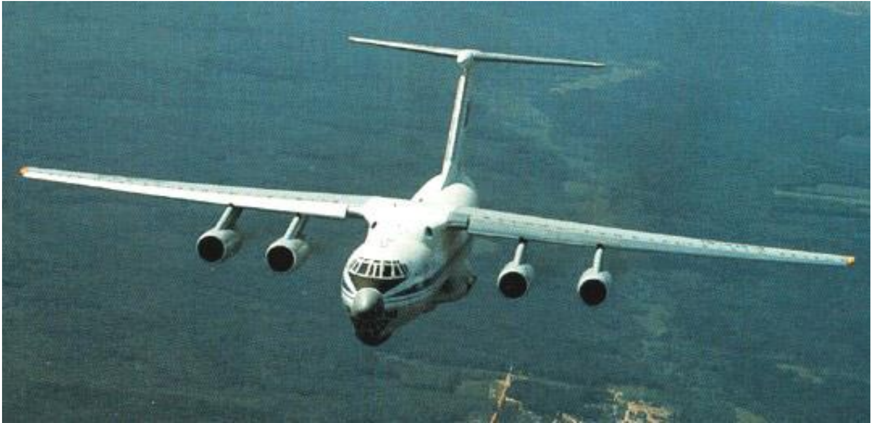
Самолет - топливозаправщик Ил-78Т