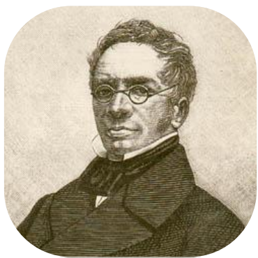
Издатель - Н. И. Греч