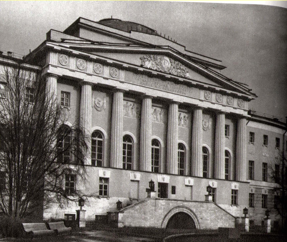
Московский Университет на Моховой.

Стиль возник во Франции в середине XVII века, с 70 годов 18 века стал господствующим в России. Подчеркнуто—правильные архитектурные формы, композиции обязательно симметричны, строгость, ясность и организованность. Яркими представителями этого направления стали В. И. Баженов (1737- 1799), М. Ф. Казаков (1738- 1812).