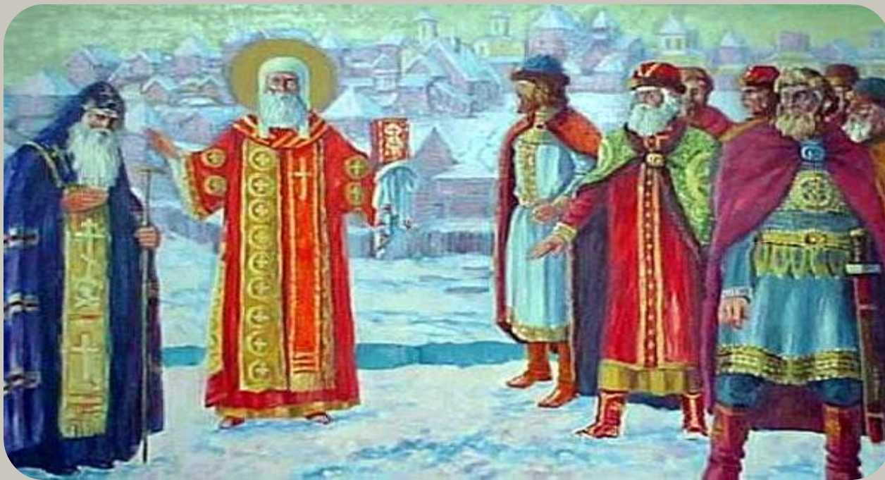
Иван Калита приглашает митрополита Петра в Москву.