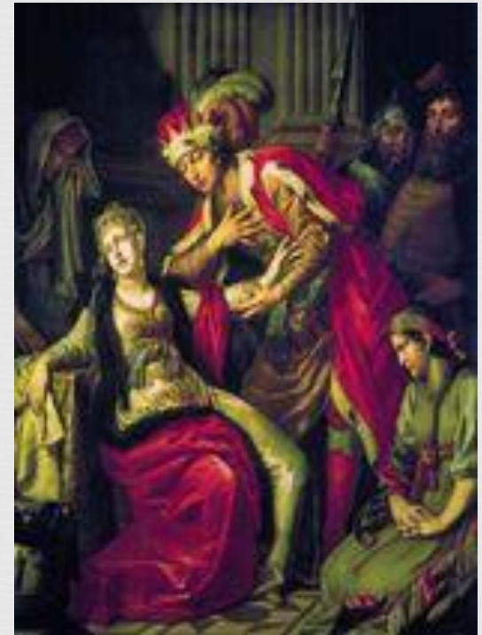
Лосенко А. Владимир и Рогнеда. 1770