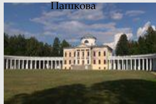
Усадьба генерала Федора Глебова Знаменское-Раёк. Конец XVIII в