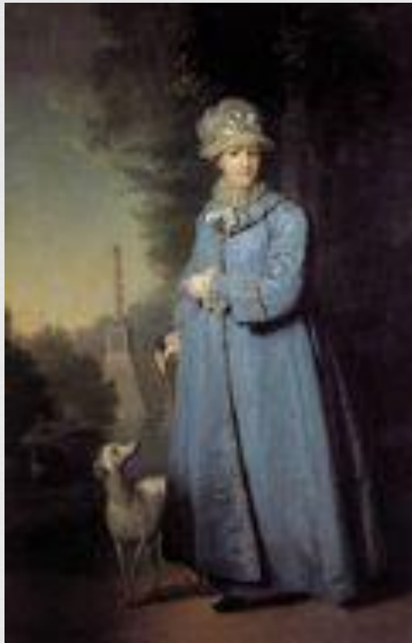
Боровиковский В. Екатерина II на прогулке в Царском селе. 1794

В живописи второй половины XVIII века царствовали два жанра — парадный портрет и историческая сцена. Заказчики предпочитали итальянскую природу как более возвышенную и одухотворенную унылым русским пейзажам, и поэтому этот жанр практически не развивался в России XVIII века. К концу столетия стали появляться изображения крестьян, написанные, впрочем, более из этнографического интереса, чем из желания вызвать к ним сочувствие.