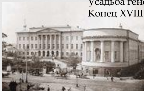
Здания Московского университета на Моховой. 1902