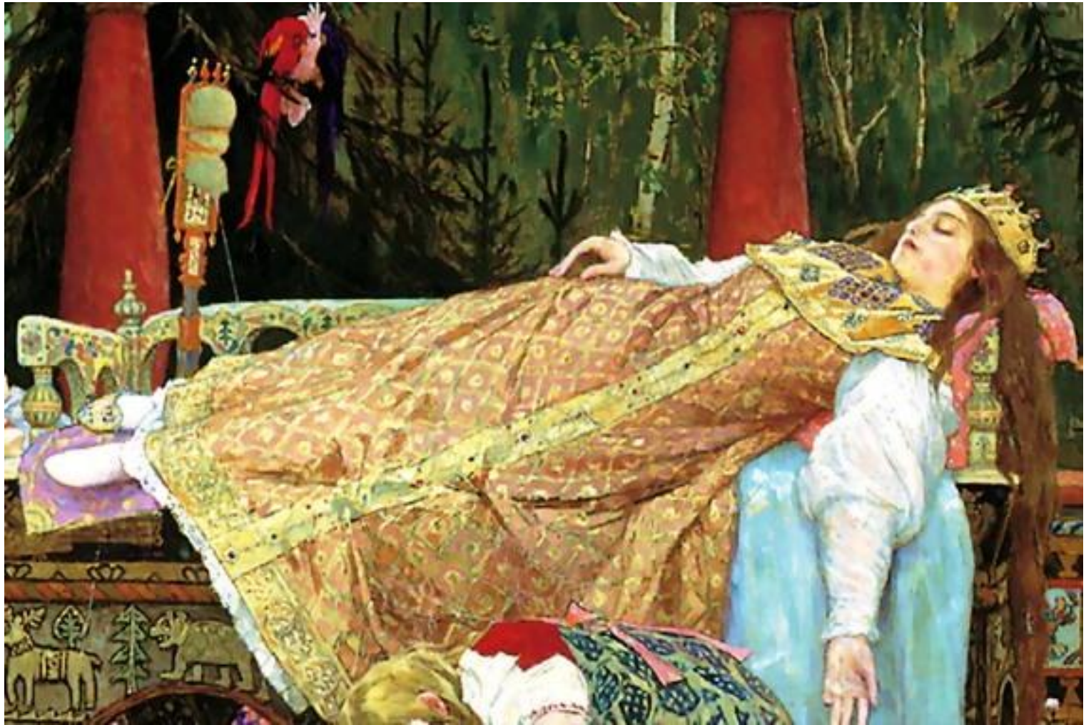
В.Васнецов «Спящая царевна»