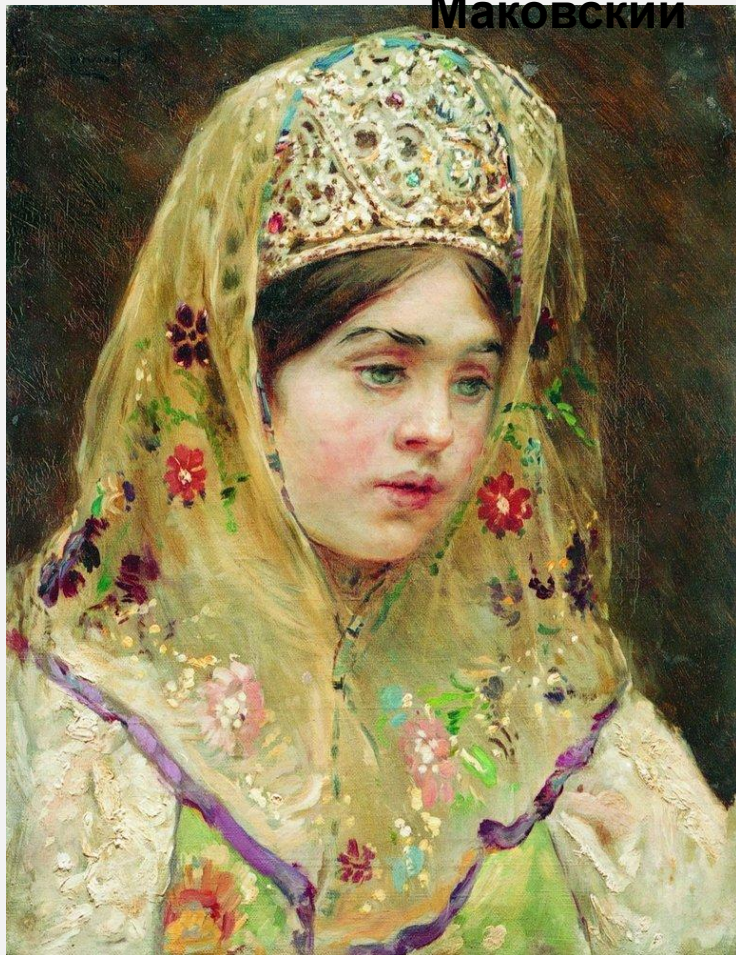
Девушка в русском костюме