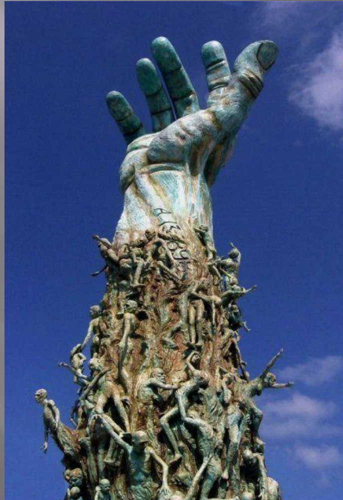
Рука в Майами (США)