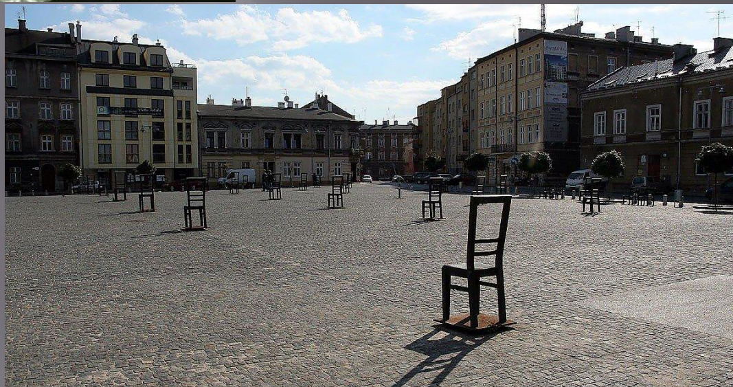
Стул за 1000 евреев (Краков, Польша)