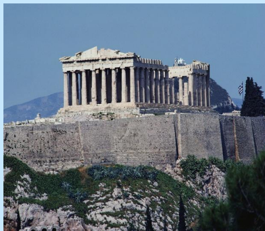
Парфенон, возведенный Греками в Афинах