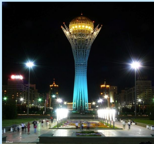
«Байтерек» г. Астана