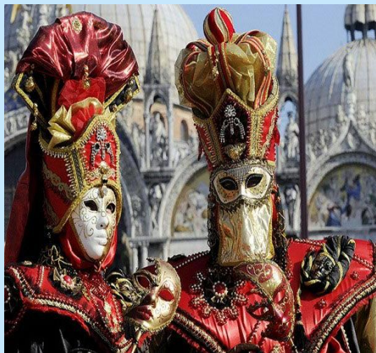
Карнавал в Венеции