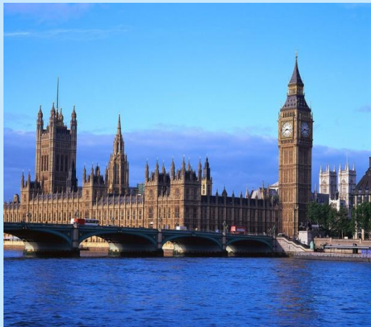
Биг Бен и здание парламента в Лондоне