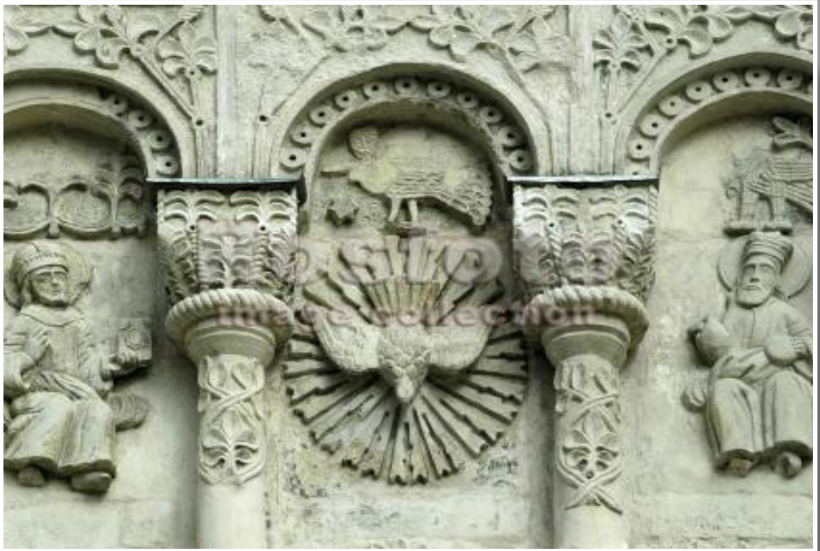
Фасад собора. Фрагмент резьбы "Сошествие Святого Духа" в виде голубя.