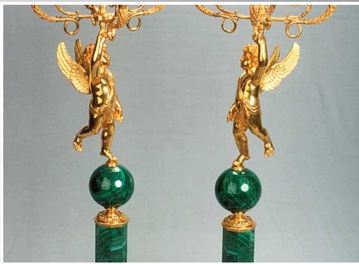
Малахитовые канделябры. Петергофская гранильная фабрика.