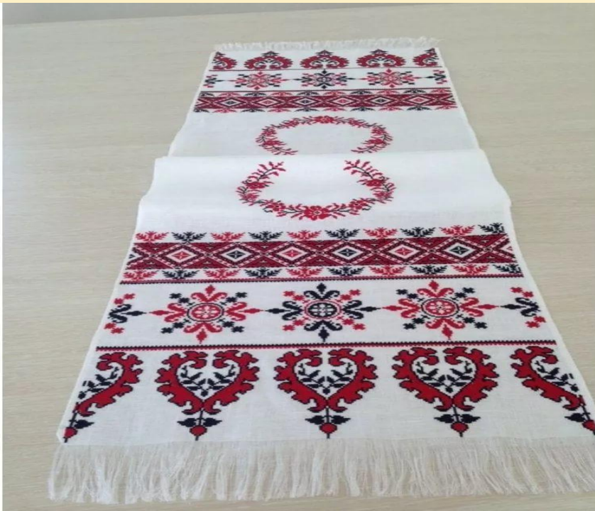
Свадебный льняной рушник