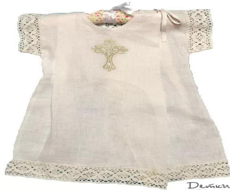
Льняная одежда для крестин