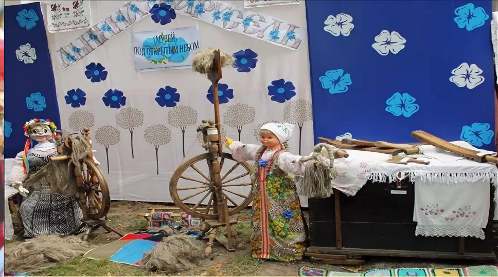
9. «Льняное подворье»