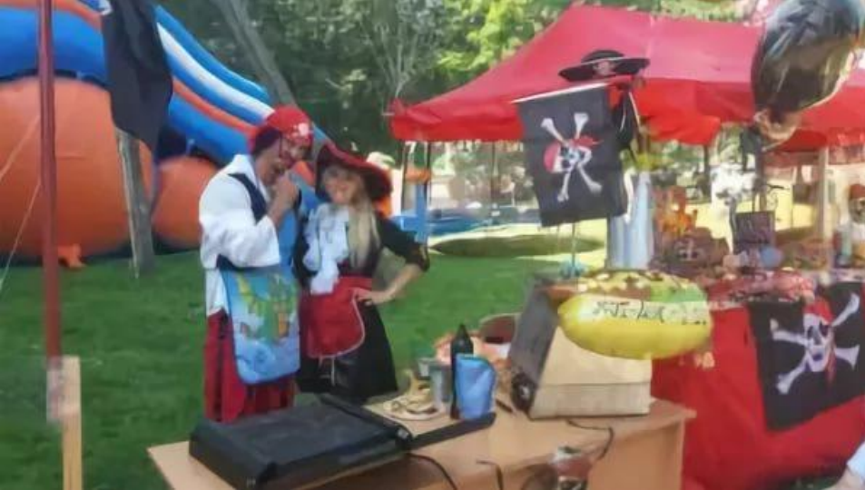
8. «Город развлечений»