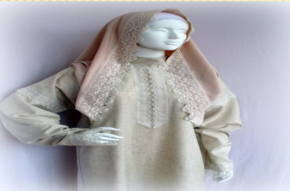
Траурная льняная одежда