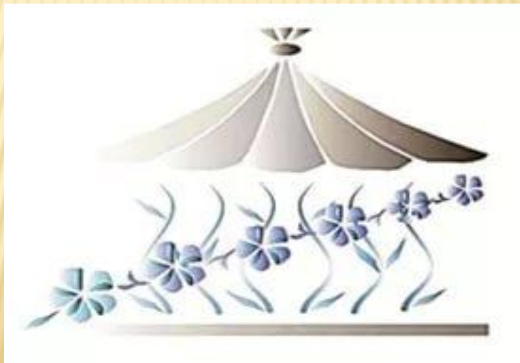
10. «Фестивальная гостиная»