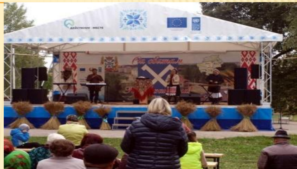
2. Выступление этно-группы «Ягорова Гара»