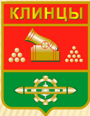
Клинцы Брянская область