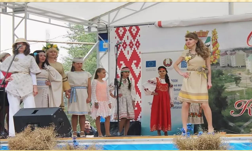
3. «Льняное дефиле» - демонстрация моделей с использованием льна