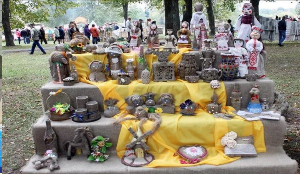
5. «Фестивальная мастерская»