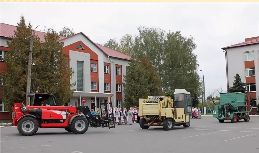
1. «Льняной парад» и торжественное открытие фестиваля