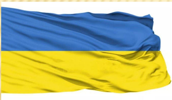
Житомирская область Украины