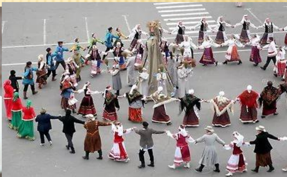
7. «Фестивальная толока»: создаём льняную карусель