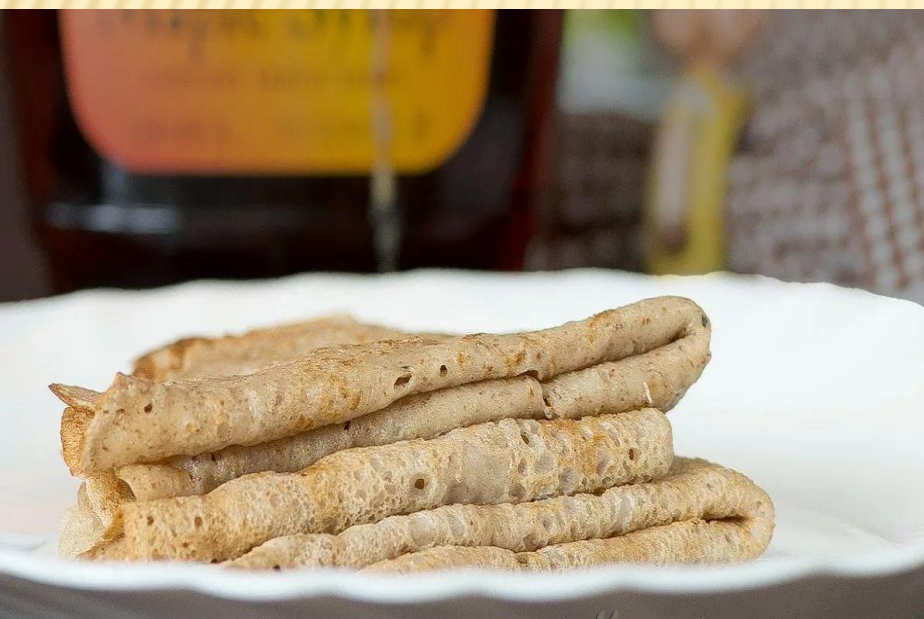
6. «Льняное бистро»