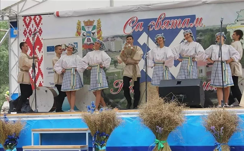
4. Творческая площадка «Лён собирает друзей»