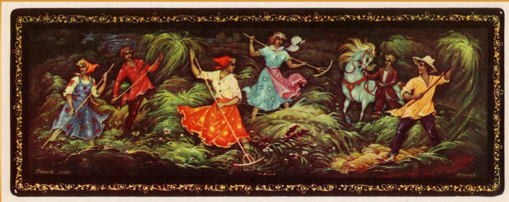
Лаковая миниатюра Холуя