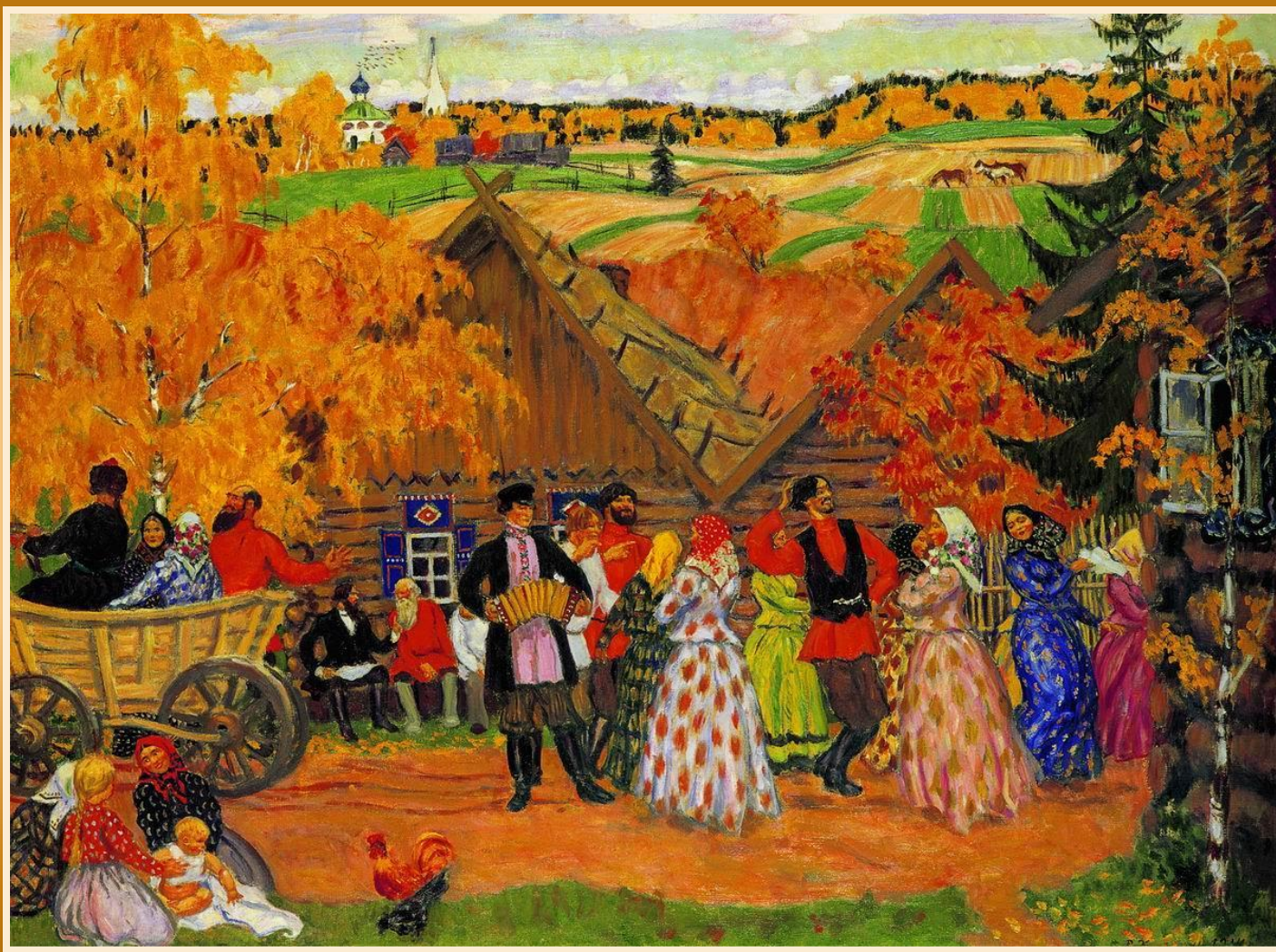
Деревенский праздник (Осенний сельский праздник)