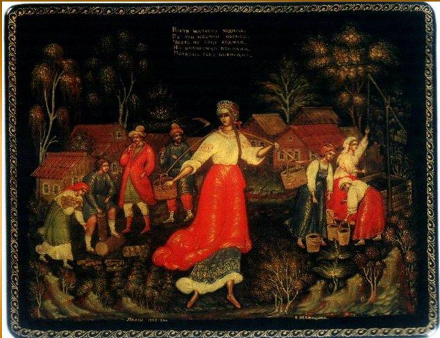
Палехская лаковая миниатюра