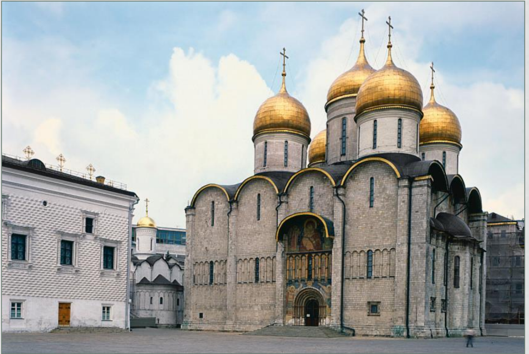
Успенский собор Московского Кремля