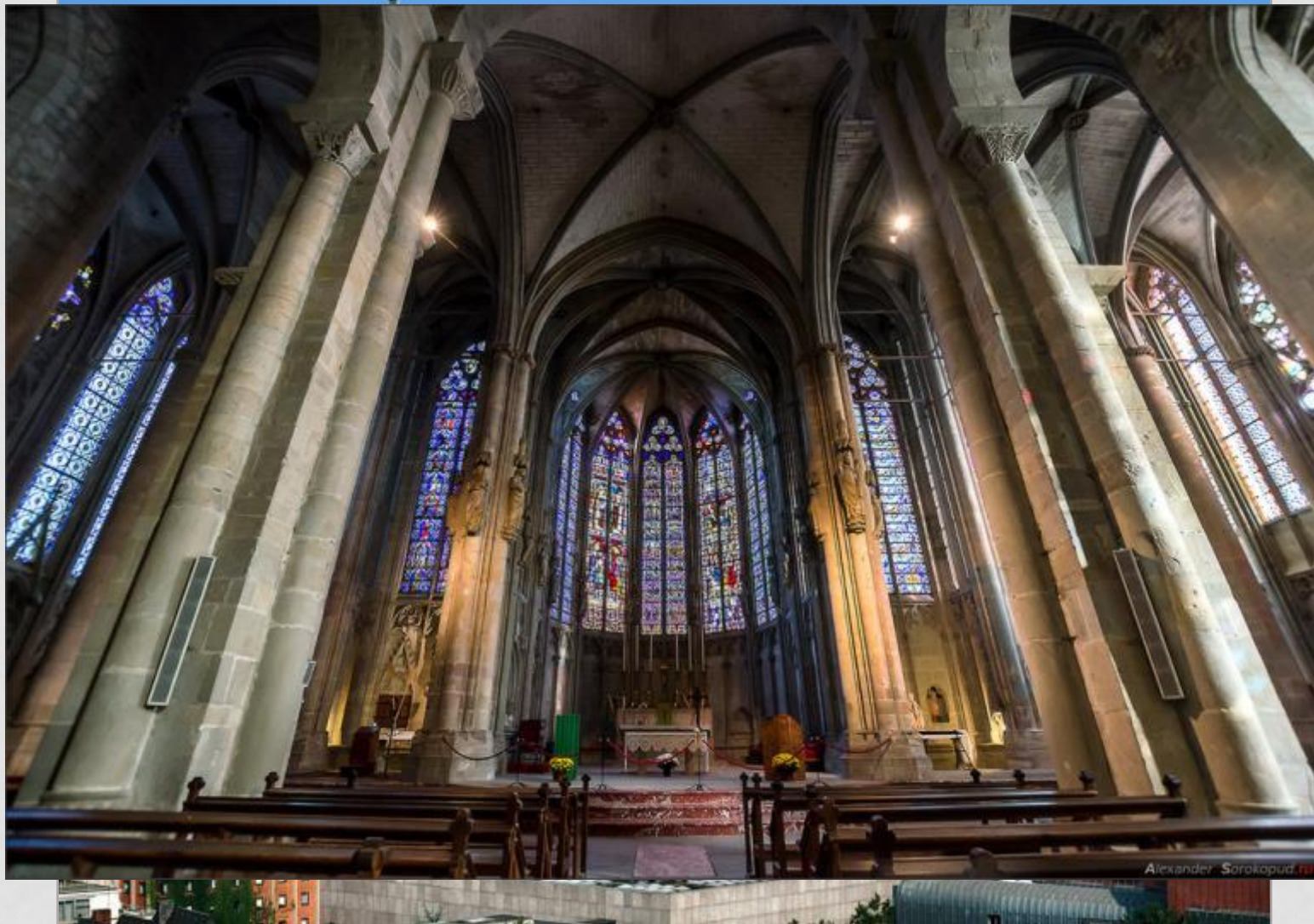
Собор в Кёльне (Германия) – 13 век