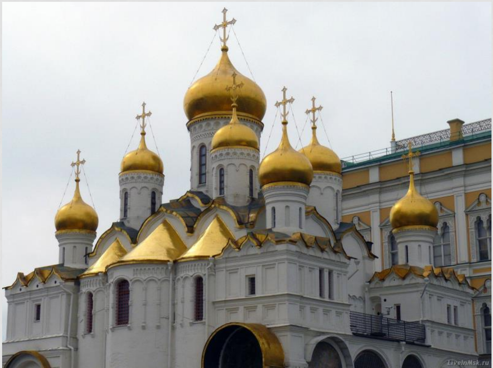
Благовещенский собор Московского Кремля