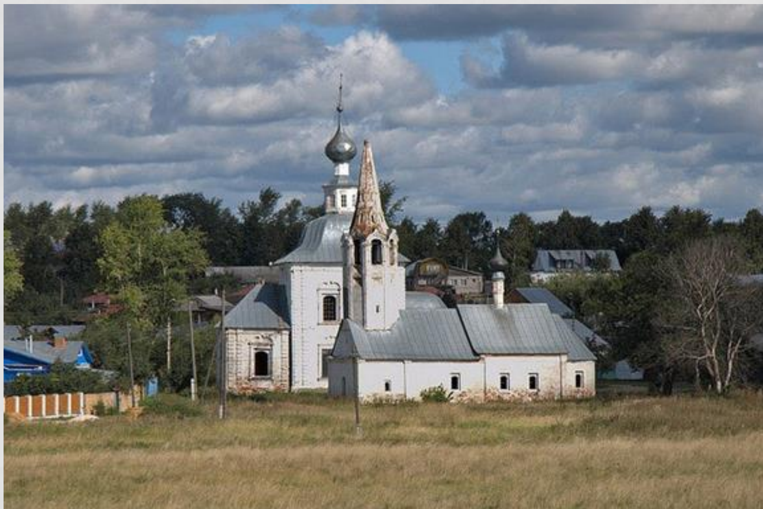
Панорама Суздаля Владимирской области. На переднем плане зимняя Предтеченская церковь, за ней летняя Богоявленская.