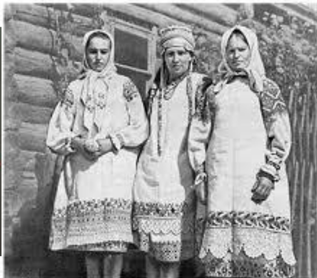
НАРОДНАЯ ОДЕЖДА С АРХАИЧНЫМ УЗОРОМ (юбка с четырьмя поясами). Русские вышивки. (Вышив, Брянская обл.)