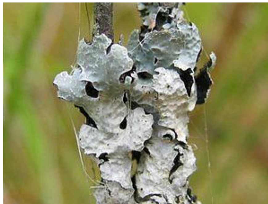
Parmelia sulcata , на поверхности видны соредии