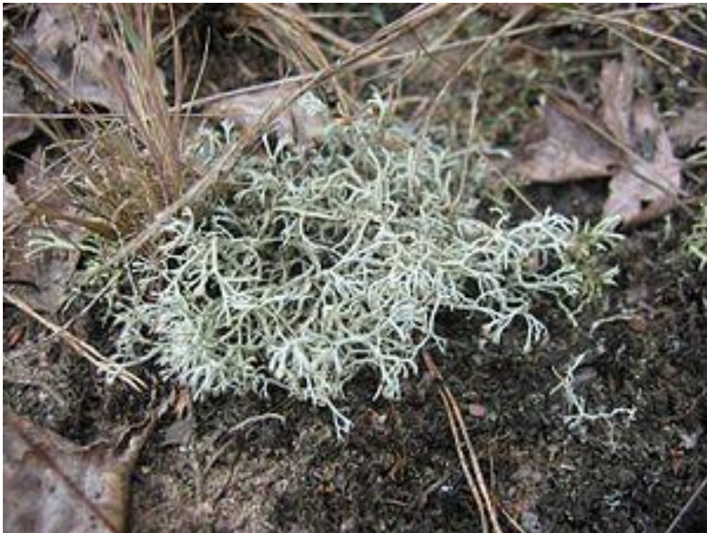
Настоящий олений мох Cladonia rangiferina в растительном сообществе Corynephorion canescentis