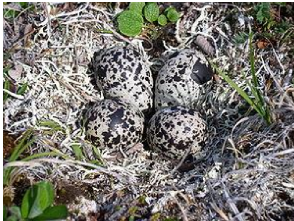
Гнездо бурокрылой ржанки, сделанное из лишайника