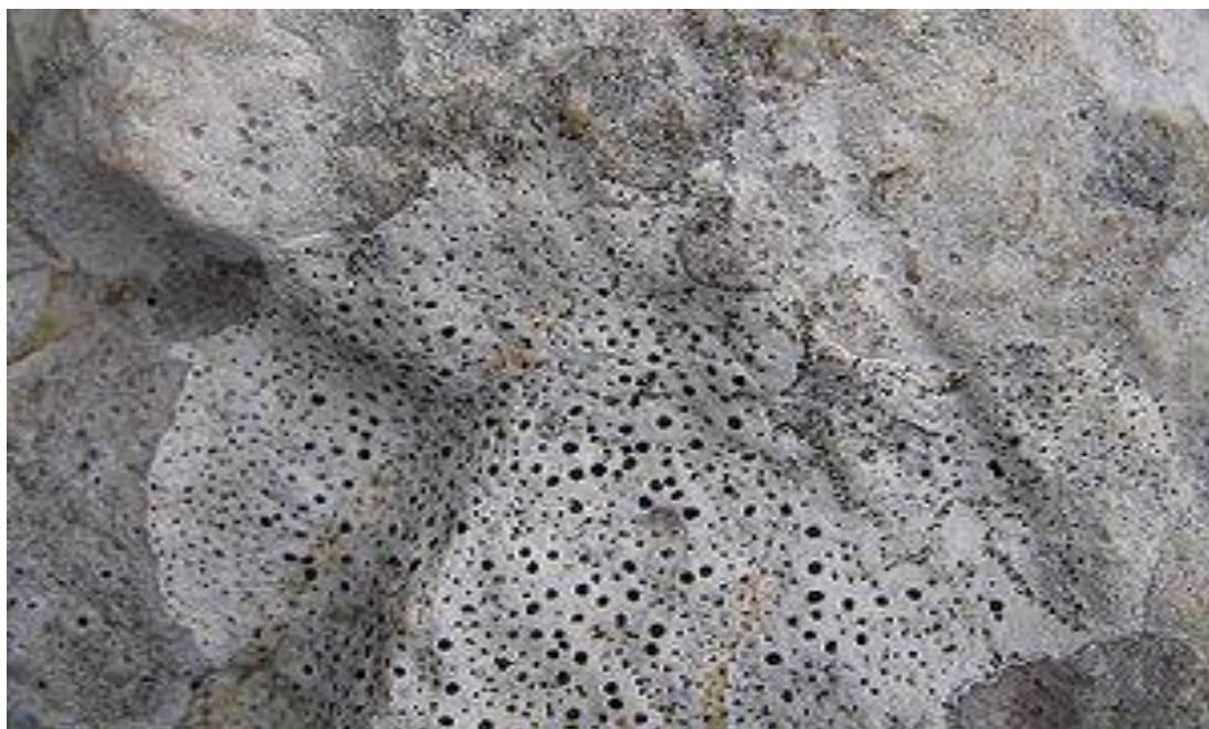
Verrucaria на известняке, чёрные ямки — это плодовые тела лишайника.