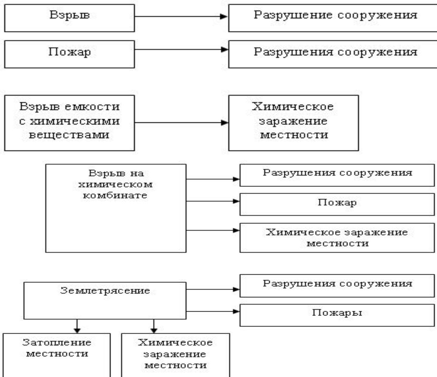
Примеры простых и сложных очагов.