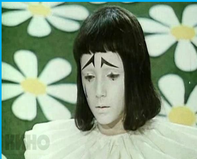
У Пьеро – разукрашенное лицо.