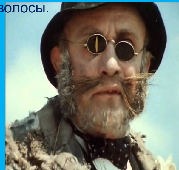
У Кота Базилио – чёрные очки.