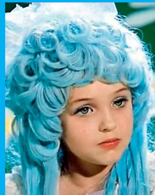
У Мальвины – голубые волосы.