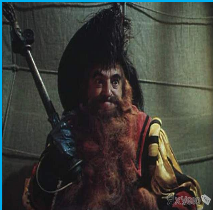
У Карабаса Барабаса – длинная борода