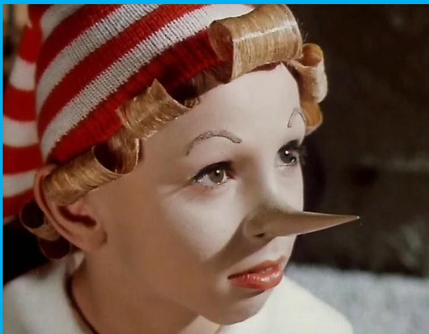
У Буратино – колпачок и нос.