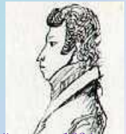
Период ссылки в Михайловское 1824 г