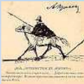
Автопортрет из альбома Елизаветы Николаевны Ушаковой. Конец сентября - начало октября 1829 г