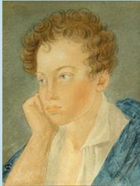
Портрет Пушкина ; Акварель С. Г. Чирикова, 1810