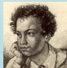
Гравюра на меди