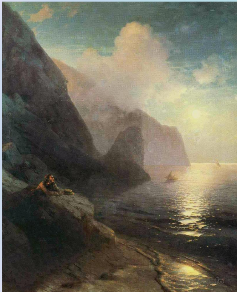
И.К. Айвазовский, Пушкин в Крыму у Гурзуфских скал

Прощай, свободная стихия! В последний раз передо мной