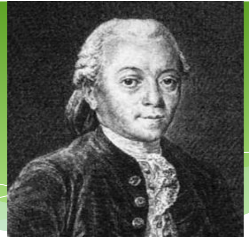
французський математик XVIIIст.

Дехто купив коня і через деякий час продав його за 24 пістолі . При продажу він втратив стільки відсотків , скільки коштував йому кінь . Питання : За яку суму він купив коня ?