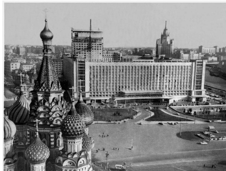
Гостиница «Россия», 1970 г.