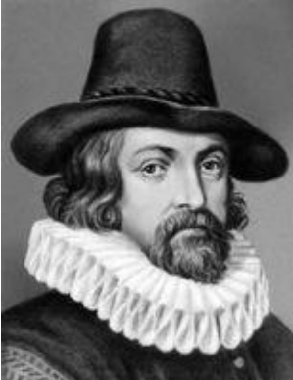
Френсис Бэкон, английский философ (1581 - 1626)