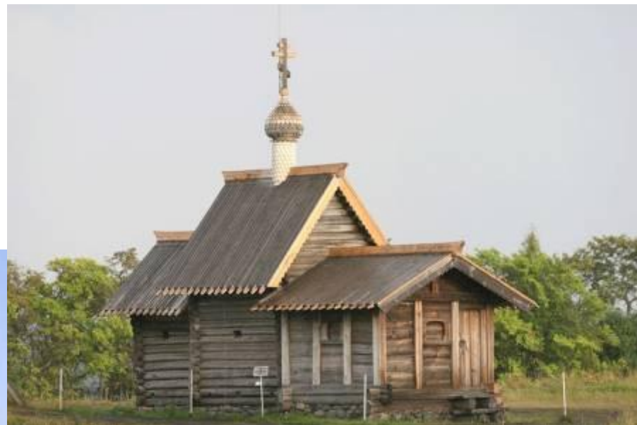
Церковь Воскрешения Лазаря. XIV век