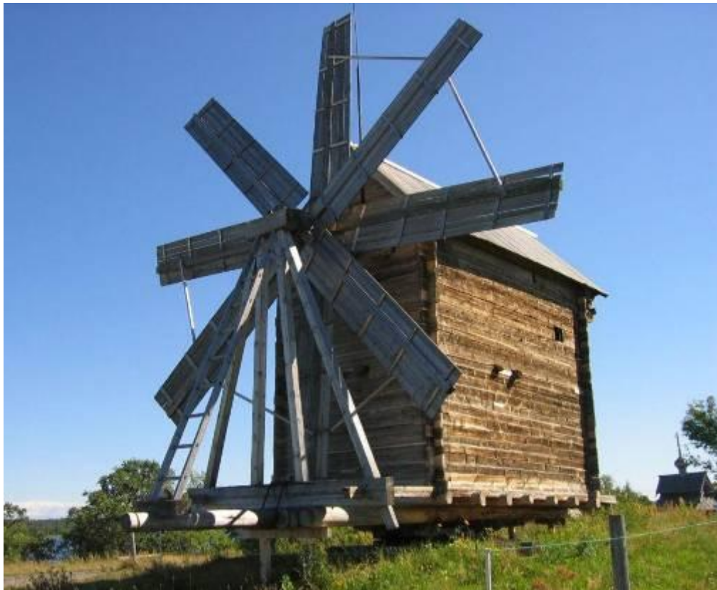
Мельница из деревни Волкостров. XIX век