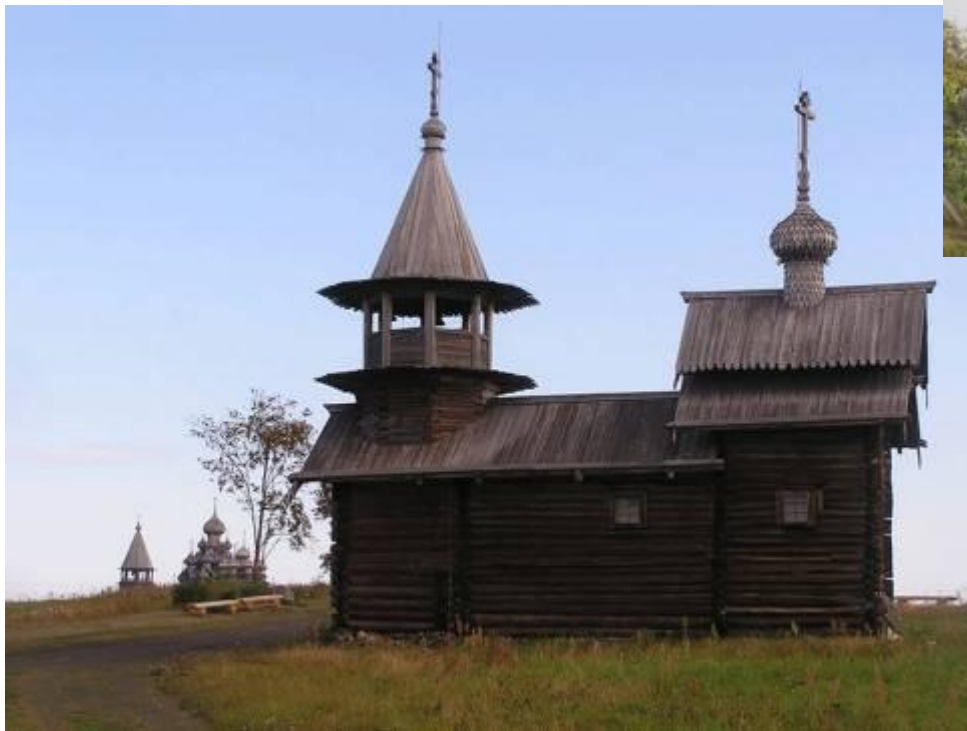
Часовня Архангела Михаила XVIII – XIX века