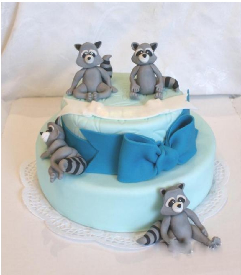
1. Наш предварительный эскиз заказа