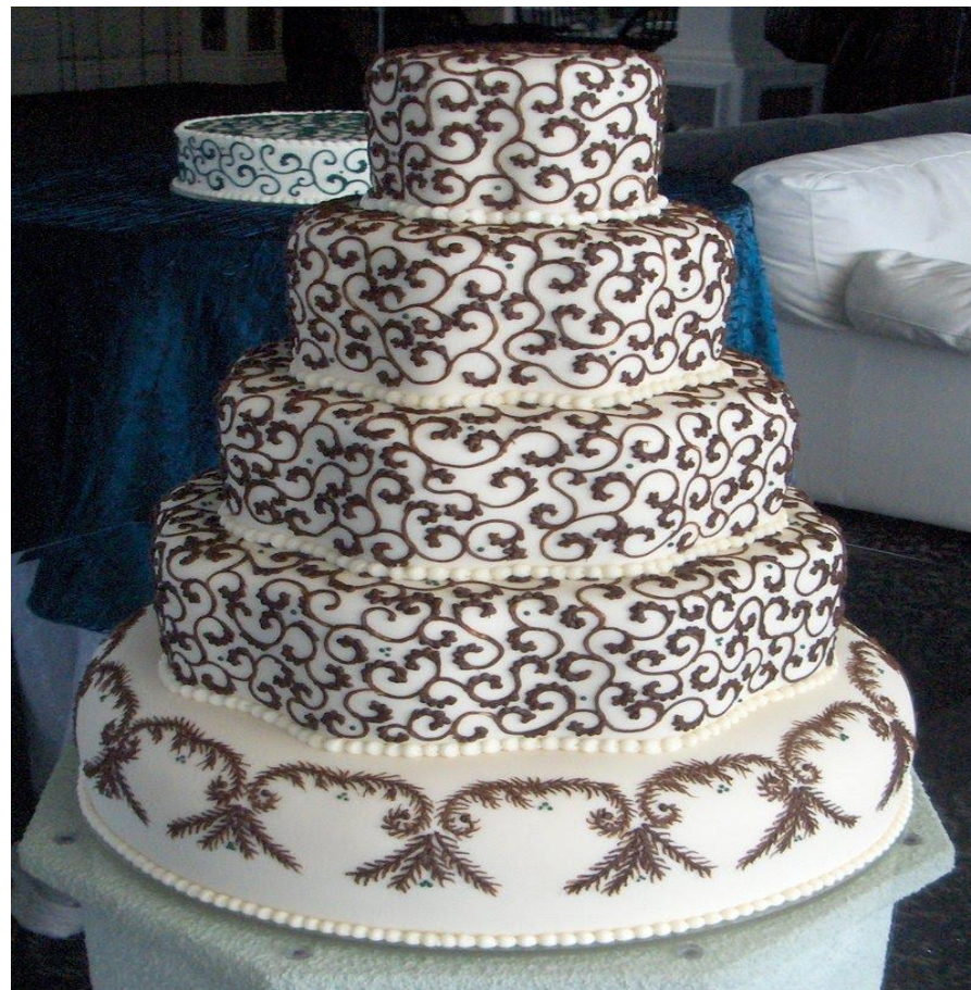
2. Торт, доставленный после возникшего конфликта