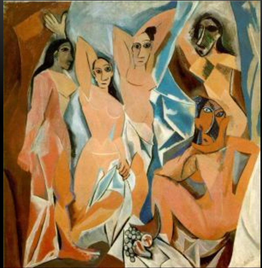
Пабло Пикассо – «Авиньонские девицы» 1907

Куби́зм (фр. Cubisme) — модернистское направление в изобразительном искусстве, прежде всего в живописи, зародившееся в начале XX века во Франции и характеризующееся использованием подчёркнуто геометризованных условных форм, стремлением «раздробить» реальные объекты на стереометрические примитивы.