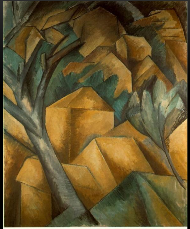
«Дома в Эстаке» – Жорж Брак

Возникновение кубизма традиционно датируют 1905—1907 годами и связывают с творчеством Пабло Пикассо. Термин «кубизм» появился в 1908 году, после того как Анри Матисс увидев пейзажи Дома в Эстаке, написанные Ж. Браком в 1908 воскликнул «Что за кубики»!