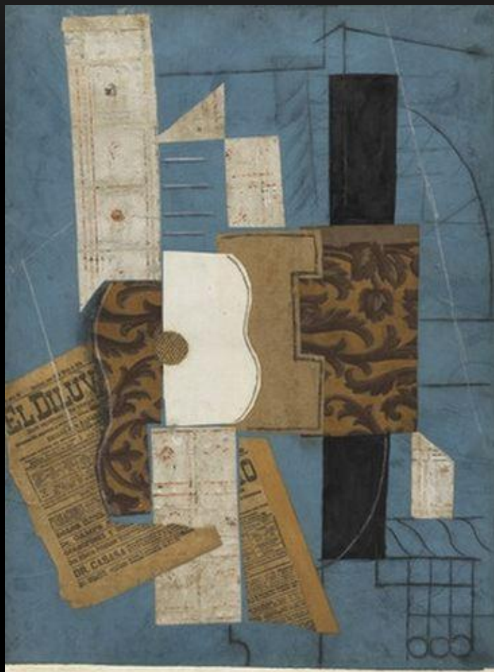
«ГИТАРА» 1913 – ПИКАССО