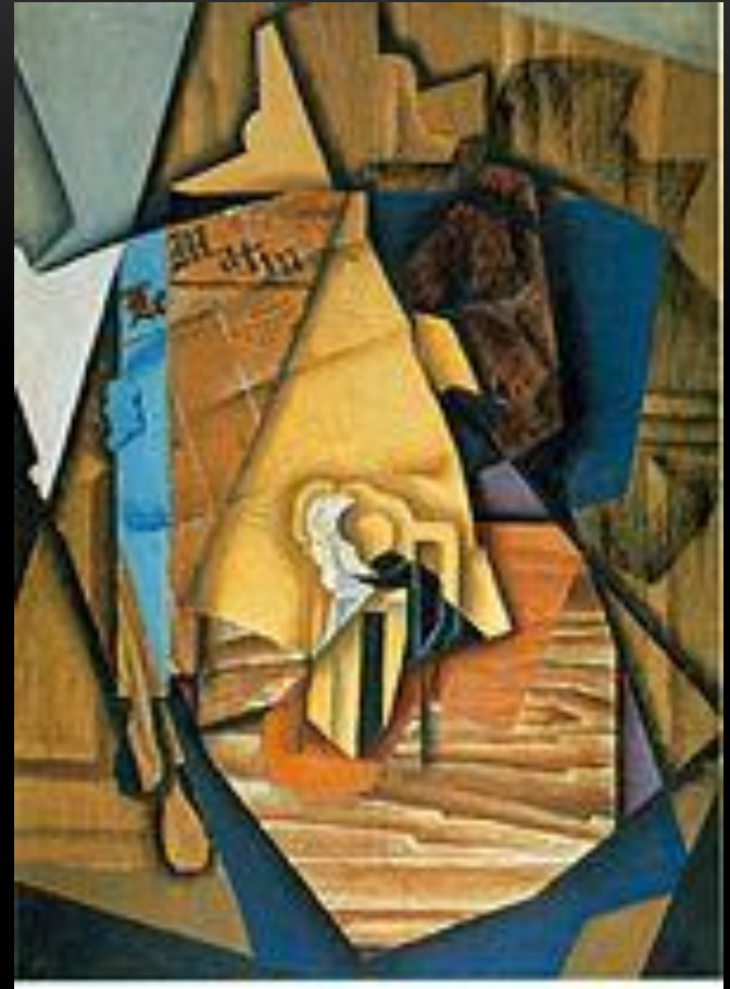
Хуан Грис Мужчина в кафе, 1914

Наиболее известными кубистическими произведениями начала XX века стали картины Пикассо «Авиньонские девицы», «Гитара», работы таких художников, как Хуан Грис, Фернан Леже, Марсель Дюшан, скульптуры Александра Архипенко и др. Кубизм развивался и за пределами Франции; особенно плодотворно — в Чехословакии.