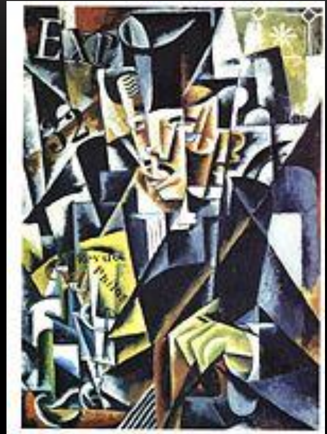
Л. Попова. Портрет философа 1915

Художники быстро перешли к кубофутуризму, честолюбиво выдвигая его в противовес кубизму в качестве более передового и уже свободного от французских влияний метода.