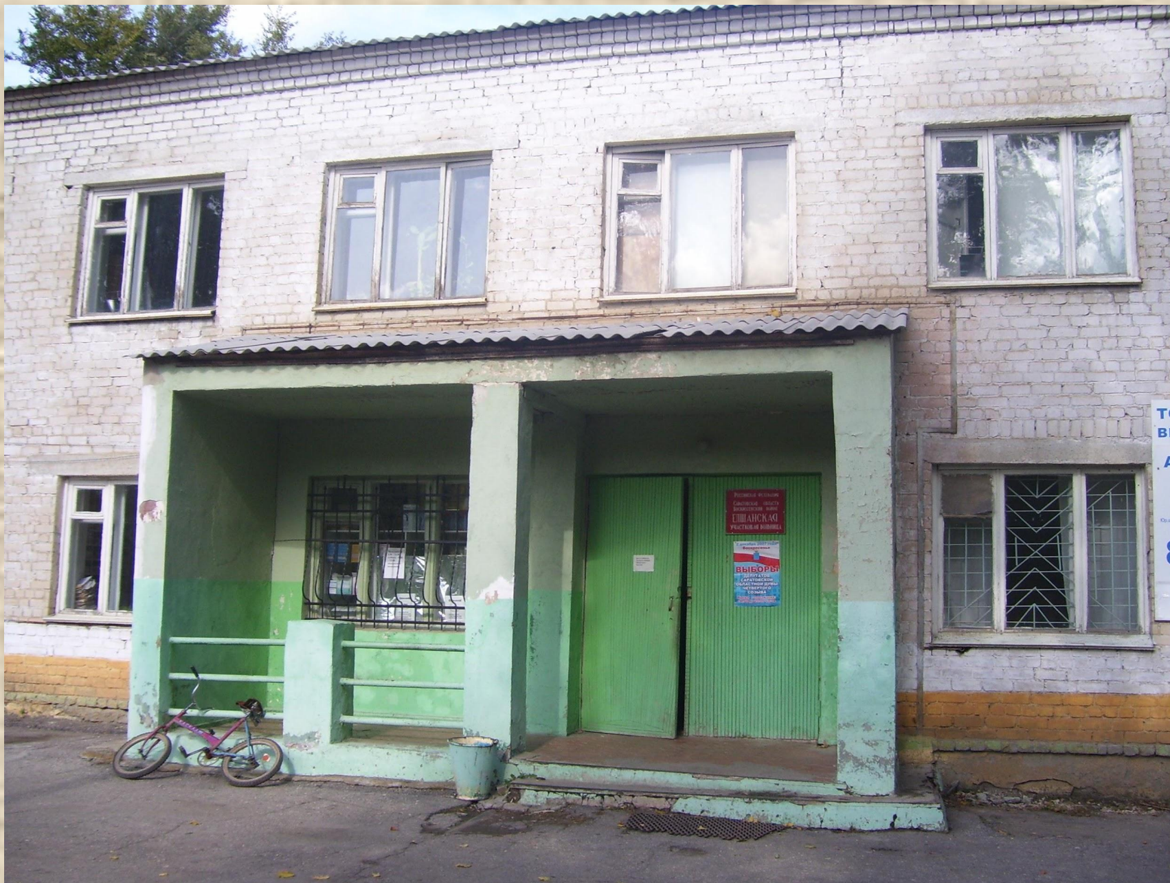
В 1969 году была построена поликлиника.