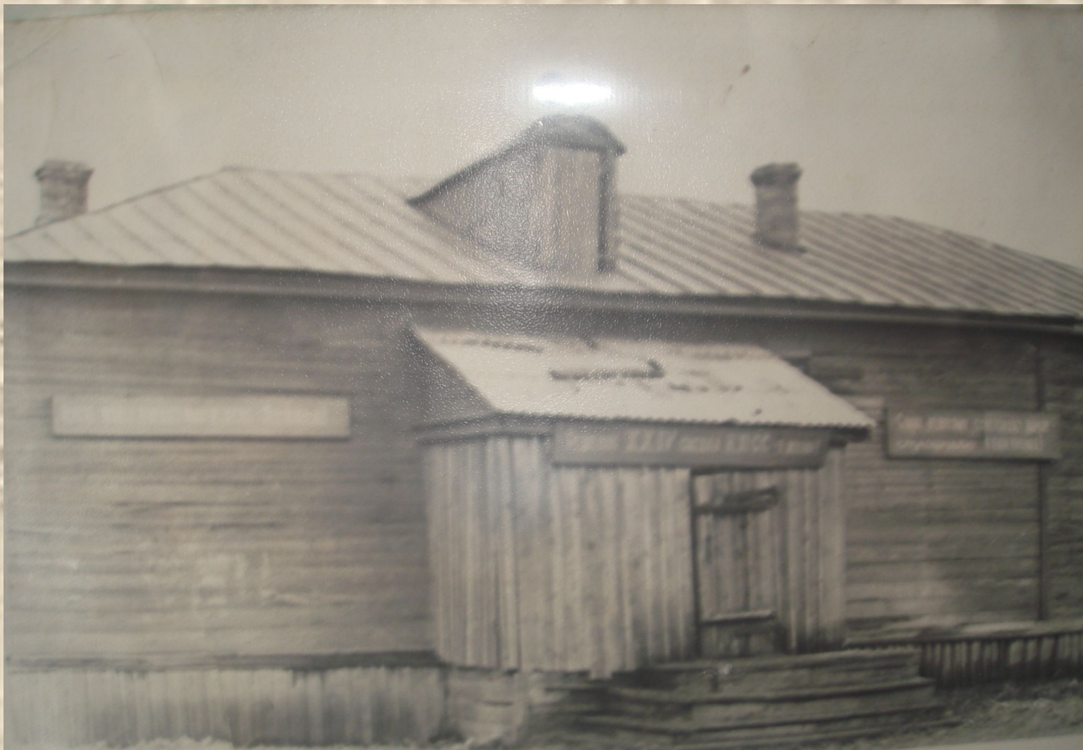
Здание сельского клуба поселковых лет. ( до наших дней здание не сохранилось )