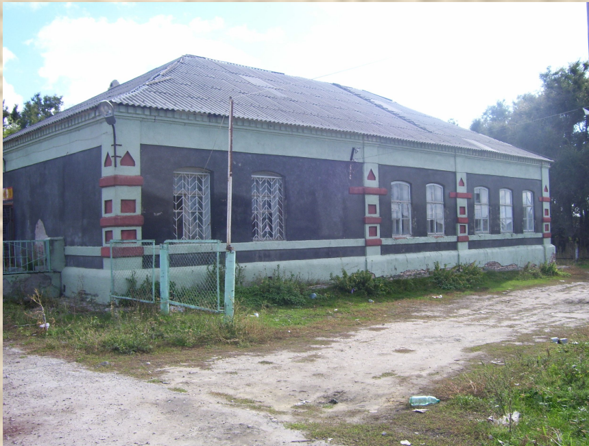
Здание церковно – приходской школы.