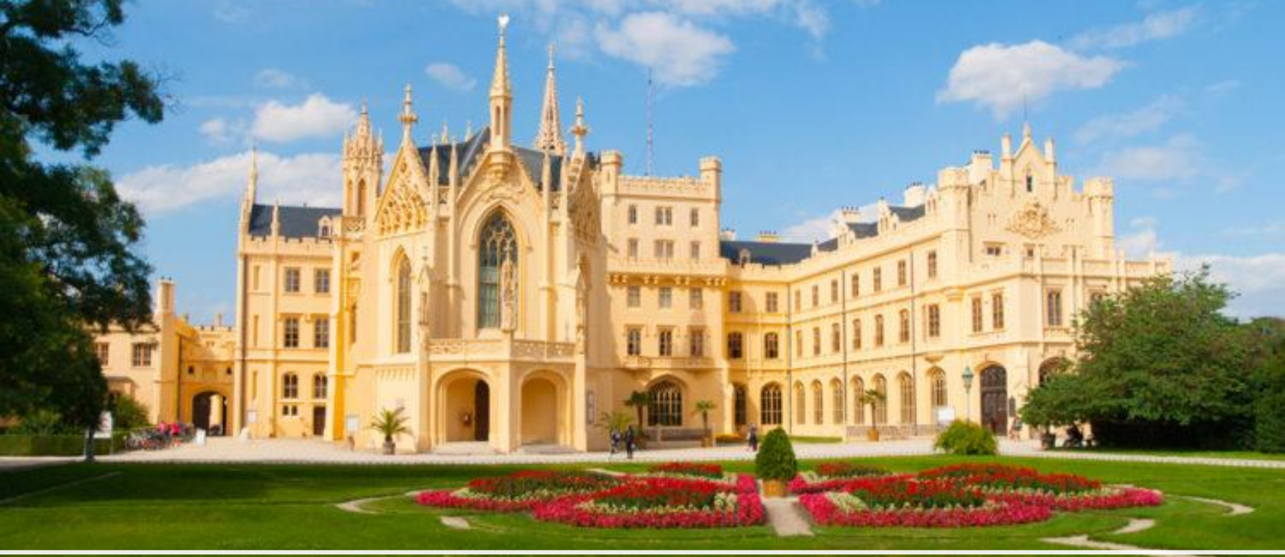
Замок Леднице (Брно)