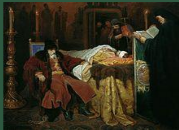
Иван Грозный у тела убитого сына Ивана