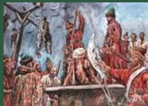
Расправа с восставшими

Болотников И.И. – предводитель восстания. Беглый холоп. Называл себя воеводой спасенного царевича Дмитрия. Восстание переросло в народную войну. Его поддерживали крестьяне, горожане, стрельцы, казаки и дворяне, верившие Лжедмитрию I.