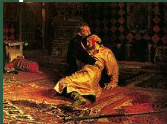
Иван Грозный и его сын Иван в 1581 г.