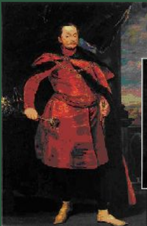
Польский король, которому присягнула «семибоярщина»