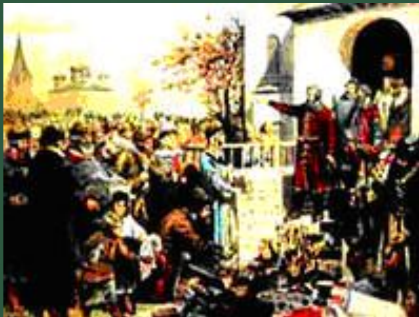
Минин призывает народ к жертвованию