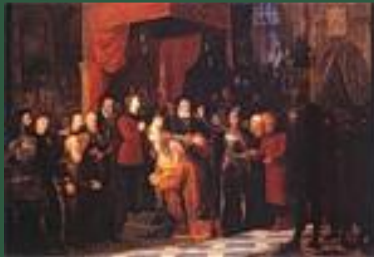
Пленный В.Шуйский в Варшаве

Его участь в конце жизни – свержение с престола, тайное подстрижение в монахи, польский плен и смерть в тяжелых лишениях.