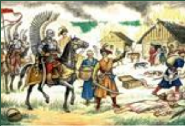
Польские войска в русской деревне