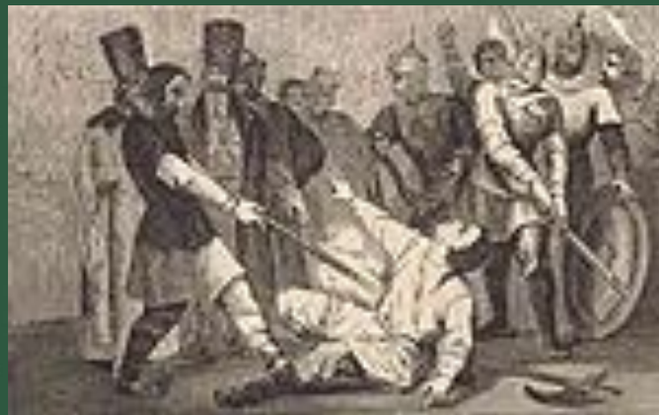
Смерть самозванца 16 мая 1606 г.

На рассвете 16 мая 1606 года вооруженный отряд под руководством В.И.Шуйского вошел в Кремль. С криком «Измена!» Лжедмитрий I попытался убежать, но был жестоко убит. Его труп подвергли торговой казни, посыпали песком, мазали дегтем. Среди жителей Москвы цареубийство вызвало неоднозначную реакцию, многие плакали, глядя на поругание. Его сначала похоронили в так называемом «убогом доме», кладбище для замёрзших или упившихся, за Серпуховскими воротами.