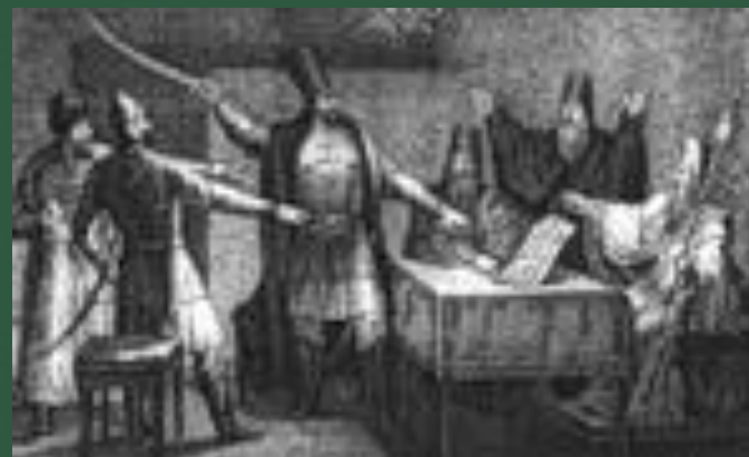
Руководители 1 ополчения