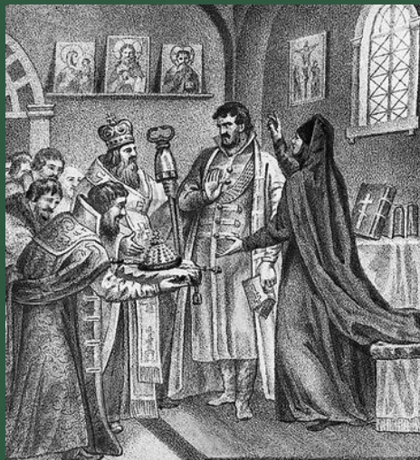
Борису Годунову сообщают об избрании на царство