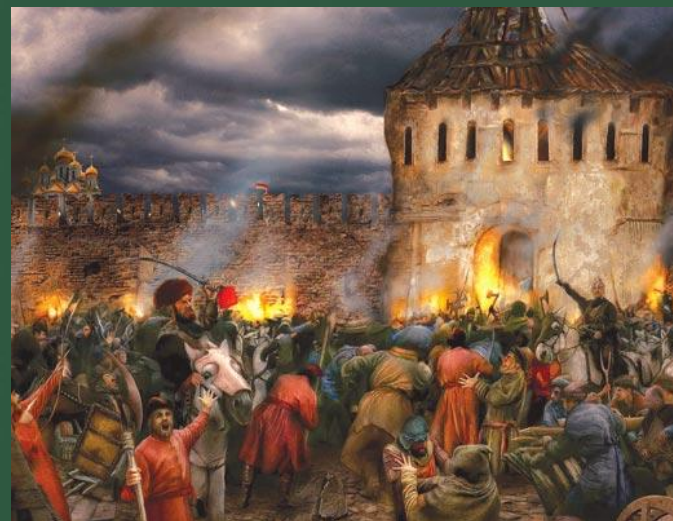
Созыв I ополчения в Рязани.

Центр - г. Рязань. Руководители: П.Ляпунов, князь Д.Трубецкой, казачий атаман И. Заруцкий