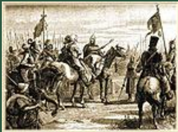
Шведы на пути к Новгороду