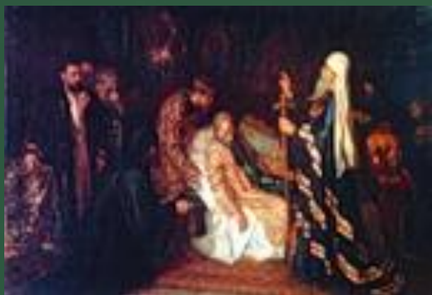
Смерть Ивана Грозного