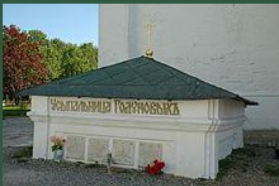
Гробница Годуновых в Троице- Сергиевой лавре