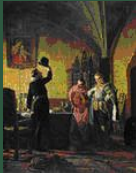
Лжедмитрий I присягает польскому королю

Польский король Сигизмунд III поддержал Лжедмитрия I и предоставил ему 4-тысячный военный отряд.