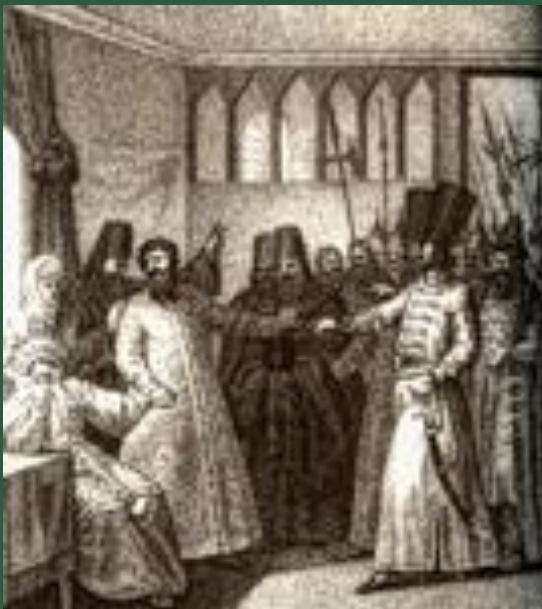
Пострижение Василия Шуйского в монахи

Его участь в конце жизни – свержение с престола, тайное подстрижение в монахи, польский плен и смерть в тяжелых лишениях.