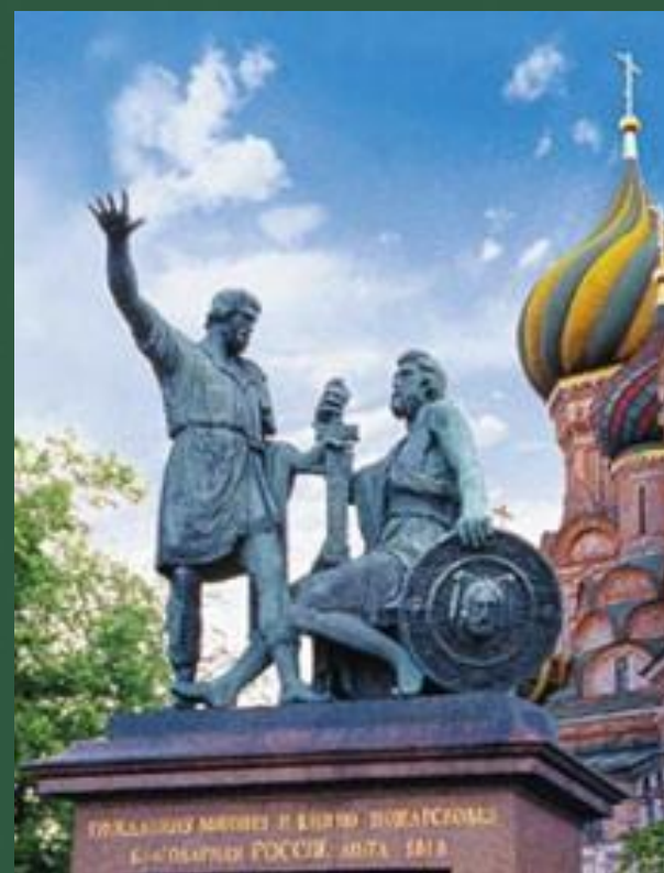
Памятник Минину и Пожарскому в Москве на Красной площади