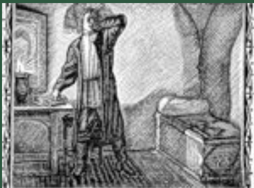
Григорий Отрепьев в монастыре

В 1602 г. в Польше объявился человек, который выдавал себя за чудом спасшегося царевича Дмитрия, младшего сына Ивана Грозного.