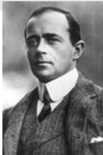
Роберт Скотт - экспедиция 1912 года

Кто написал эти слова, и где проходила последняя в его жизни экспедиция?