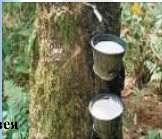
Гевея или каучуковое дерево

А то, что находится в ящике, напрямую связано с данным растением. Что это может быть?