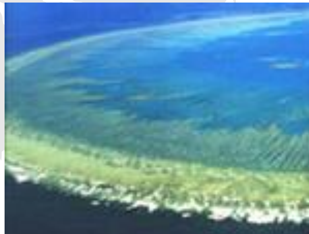
Большой Барьерный риф в Австралии