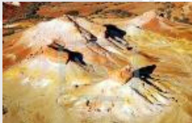
Пустыня около озера