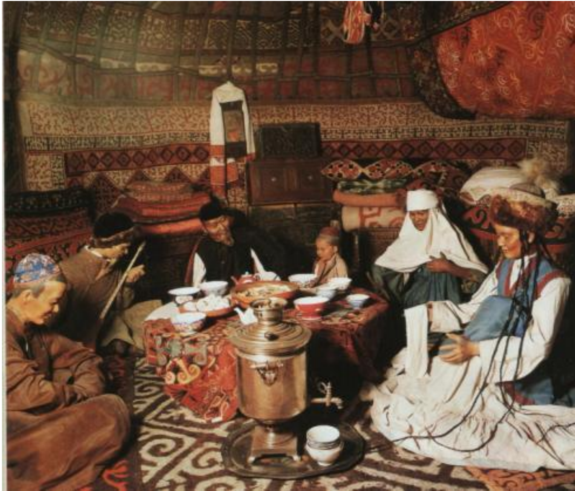
Экспозиция Российского этнографического музея “Казахи. Кон. XIX – нач. XX в. ”: внутреннее убранство казахской юрты. Санкт-Петербург. Россия. Тип экспозиции – ансамблевый