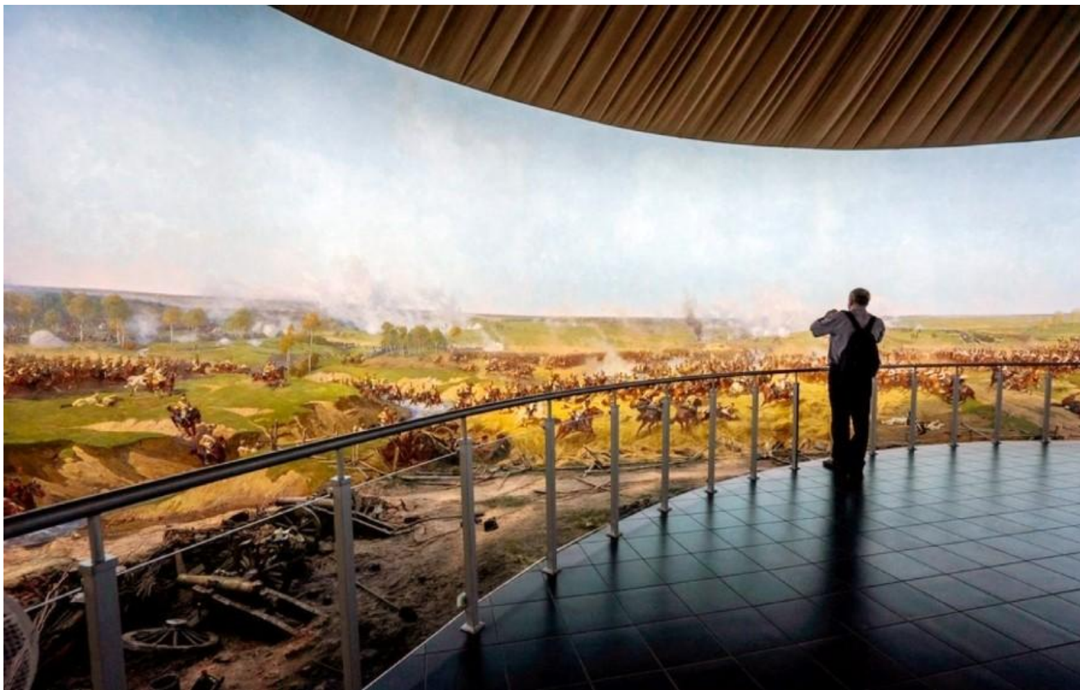
“Кавалерийский бой во ржи”. Фрагмент Бородинской панорамы. Музей-панорама “Бородинская битва” .Москва. Россия.