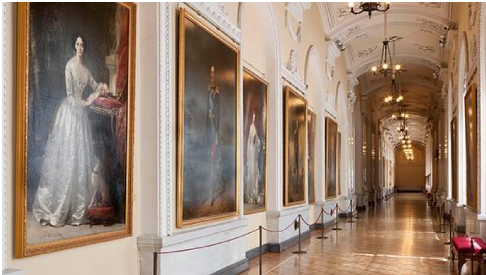
Эрмитаж. Галерея портретов Романовых. Санкт-Петербург. Россия.