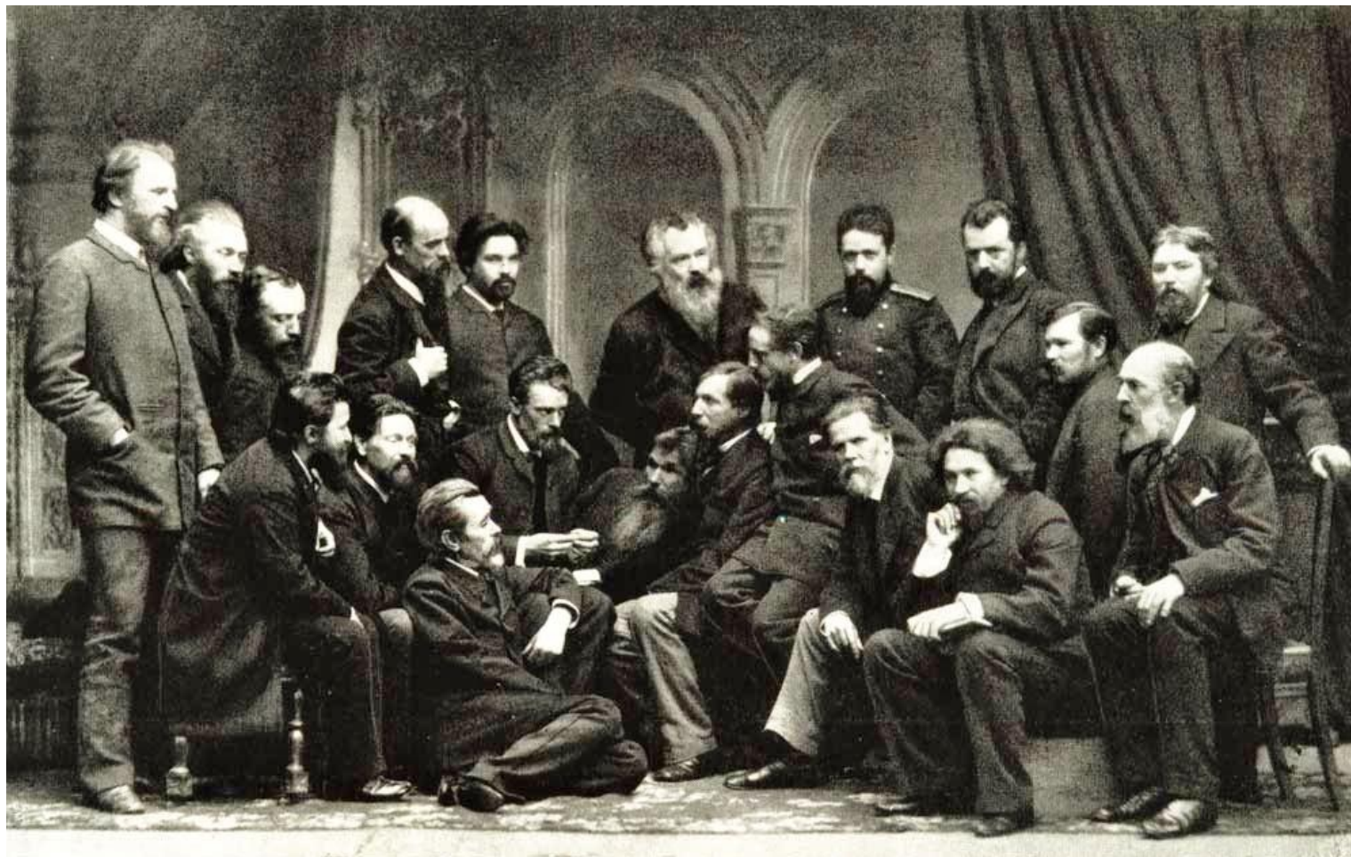
Группа членов Товарищества передвижных художественных выставок. 1886 г.