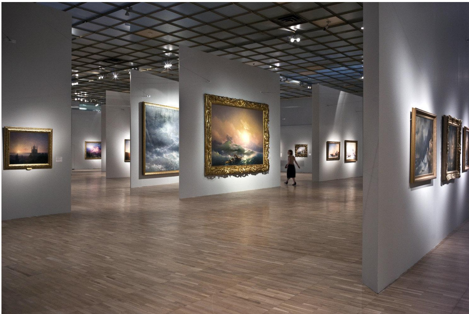
Третьяковская галерея. Выставка И.К.Айвазовского. Москва. Россия.