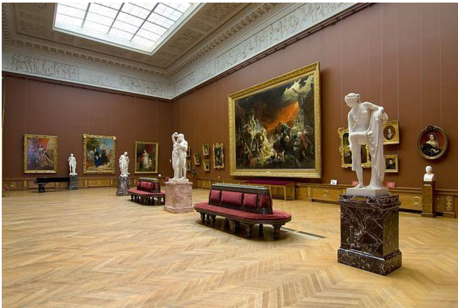
Русский музей. Постоянная экспозиция “Русское искусство первой половины XIX века”. Санкт-Петербург. Россия