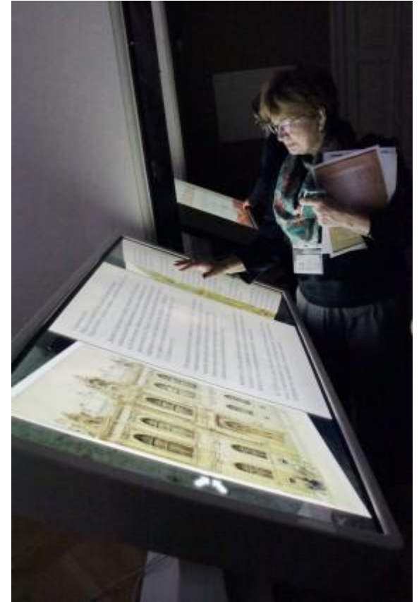
Цифровая выставка "Неделя Покрова". Центр Мультимедиа Русского музея. Санкт-Петербург. Россия.