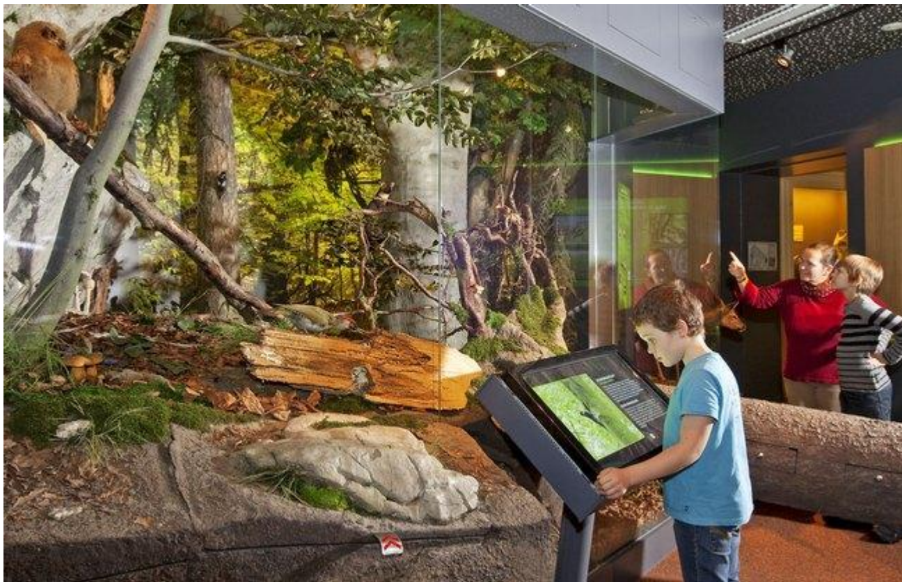
Биогруппа в музее “Дом Природы”. Зальцбург. Австрия. Тип экспозиции - ландшафтный.