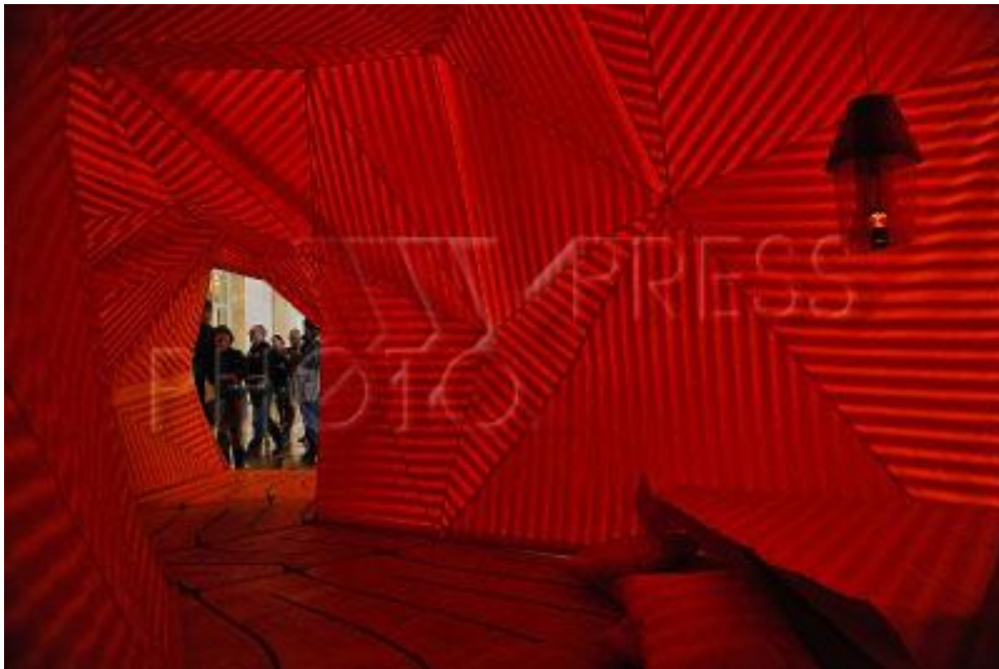
Выставка “Центр Помпиду в Эрмитаже”. Санкт-Петербург. Россия.