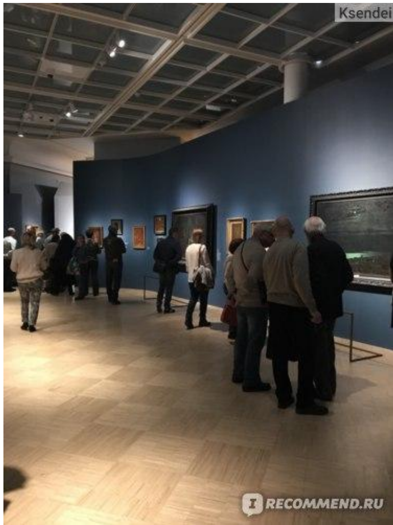
Выставка “Архип Куинджи”. Третьяковская галерея. Москва. Россия.