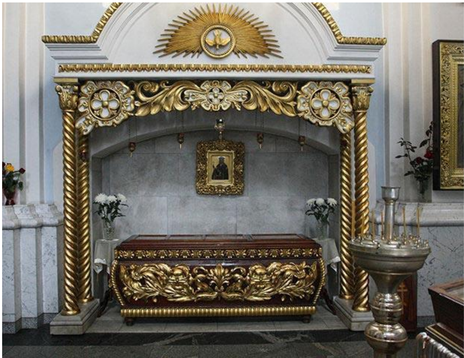
Мощи святой праведной Софии, княгини Слуцкой