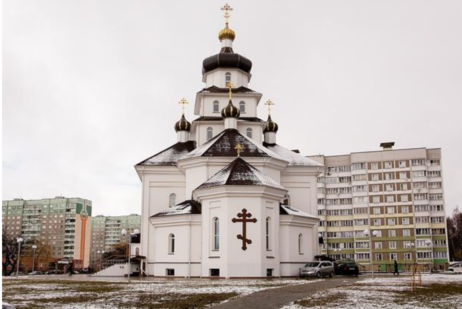
Храм св. Софии Слуцкой, г. Минск.