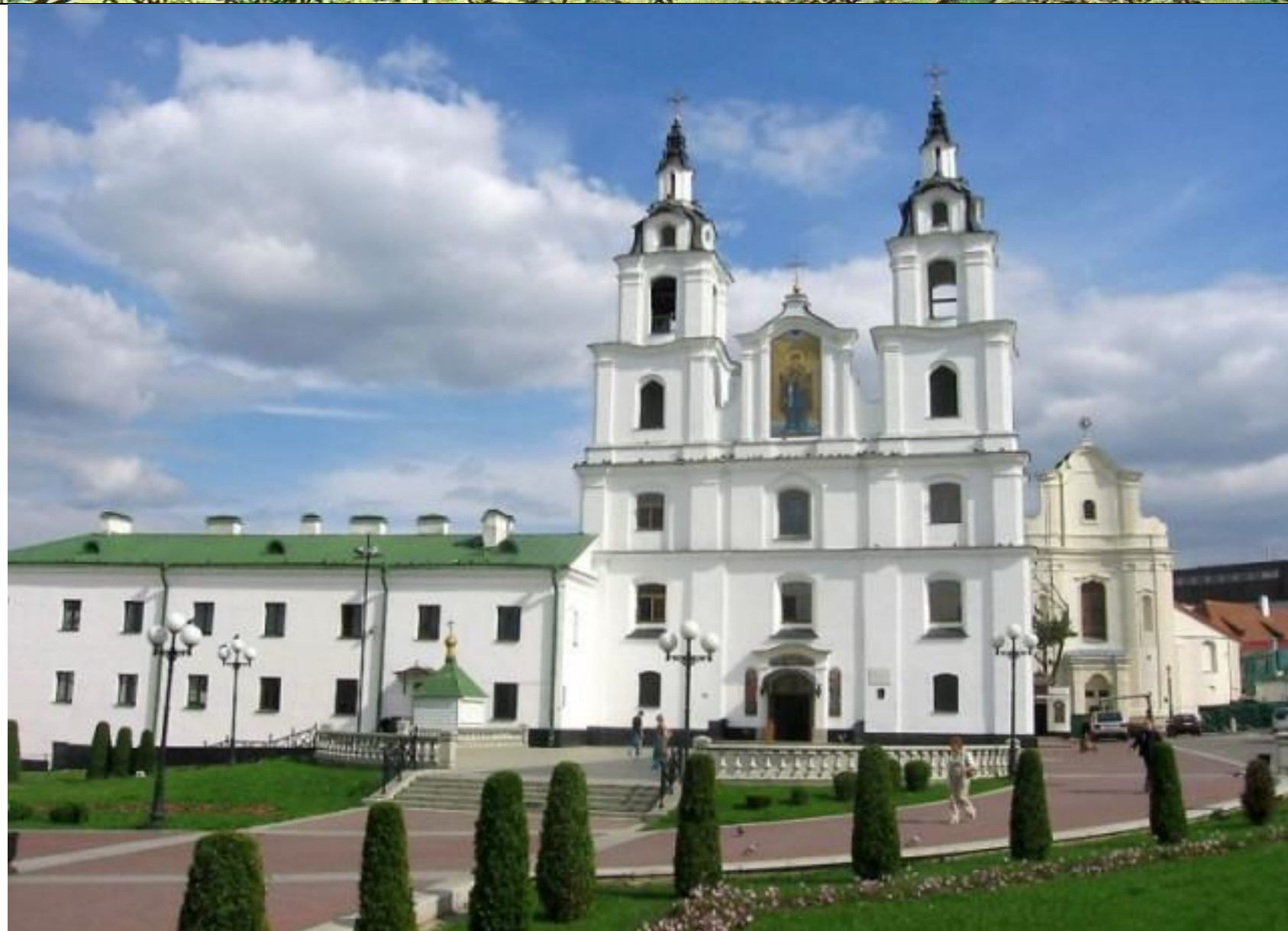
Минский Свято-Духов кафедральный собор.