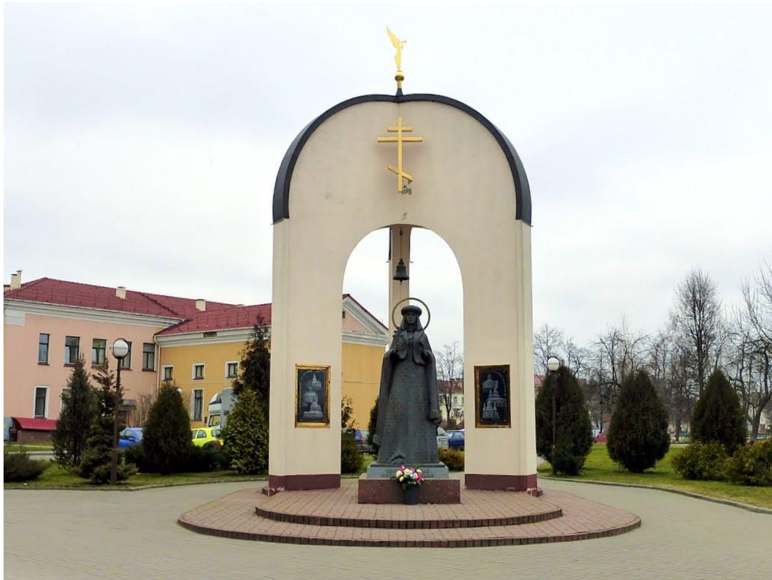
Памятник Софии Слуцкой, г. Слуцк