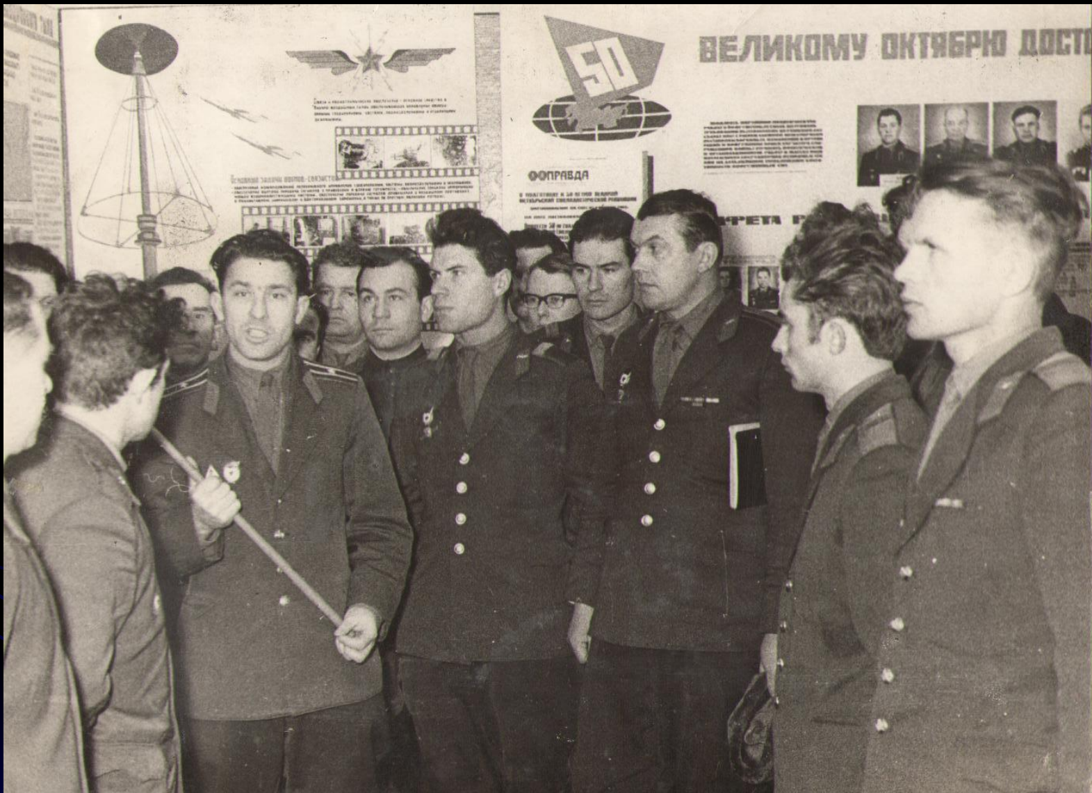
Собрание в музее Боевой Славы, посвященное Г.С.Титову