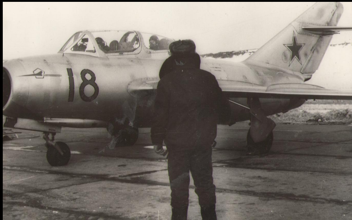
Самолет МиГ-15 Титова Г.С.