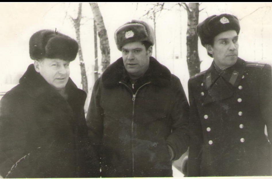
Титов Г.С. встречается со старыми друзьями-однополчанами