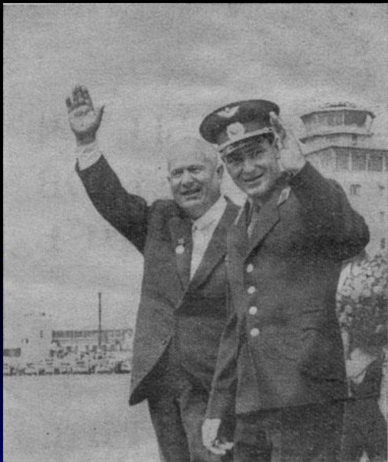
Встреча Титова Г.С. с Хрущёвым Н.С