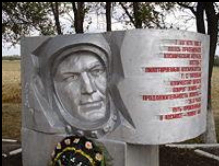
Памятник, установленный на месте приземления «Востока 2» Красный Кут Саратовской области