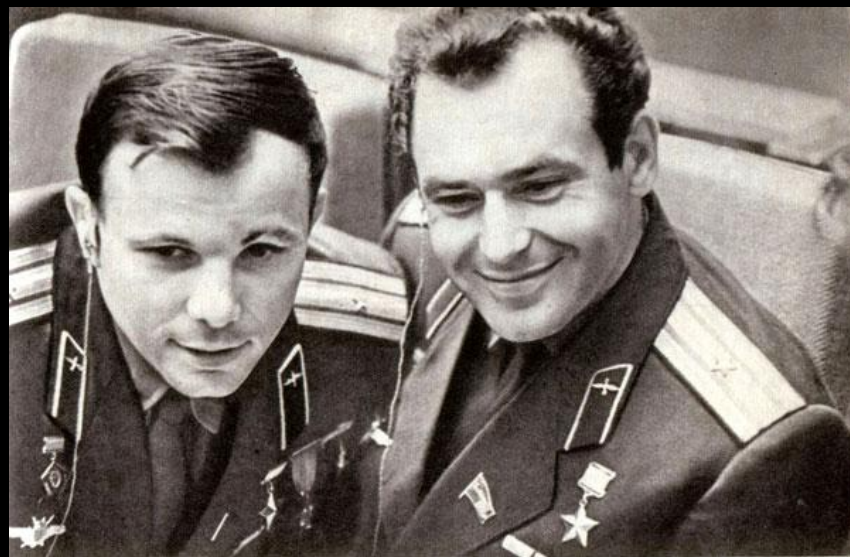
Гагарин Ю.А и Титов Г.С —навекы друзья