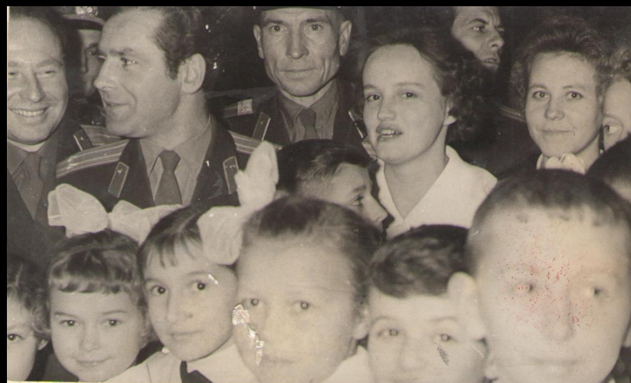
Рассказы о космосе никого не оставляют равнодушным