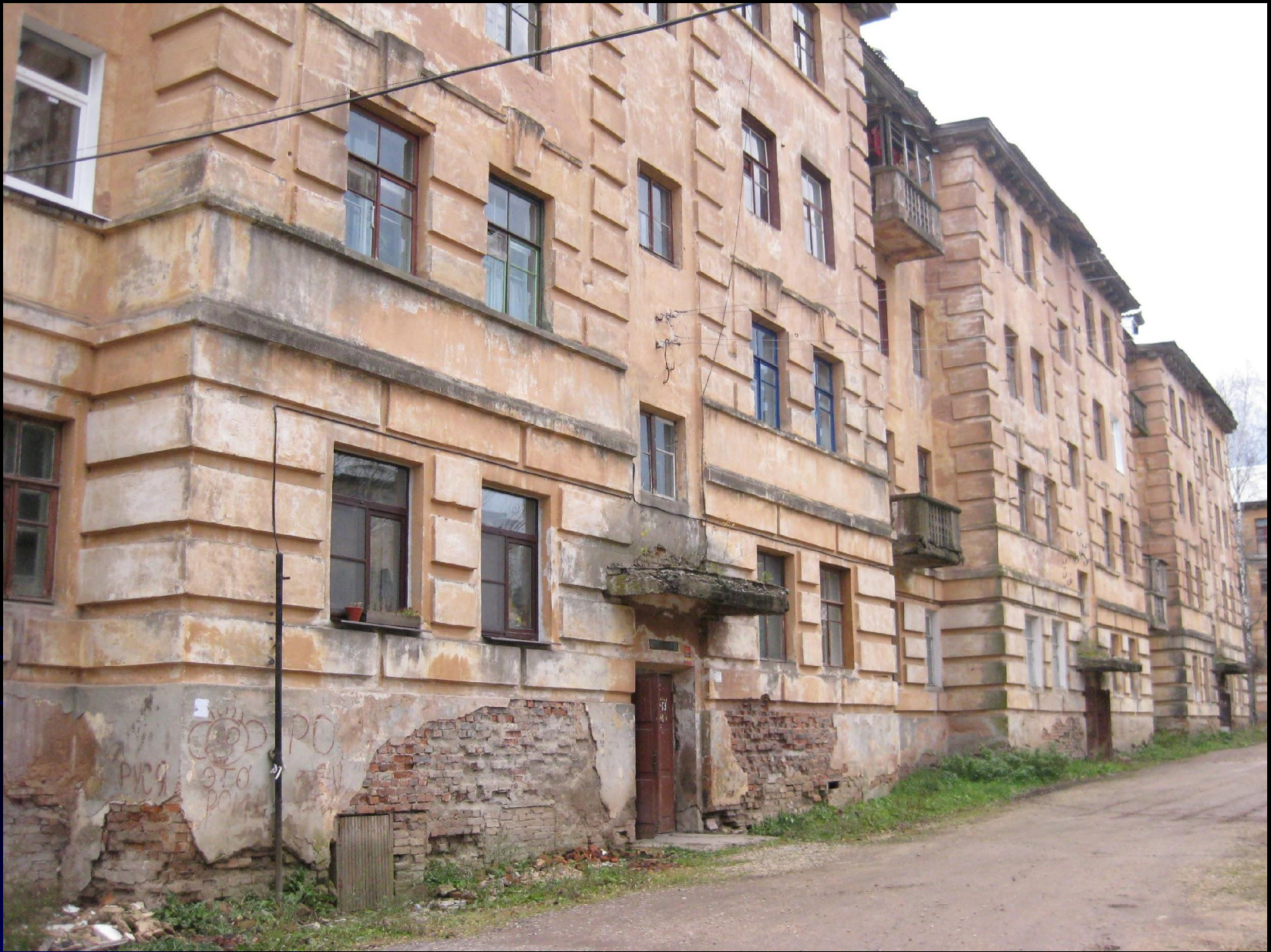
Дом ,в котором жил Г.С. Титов со своей семьей