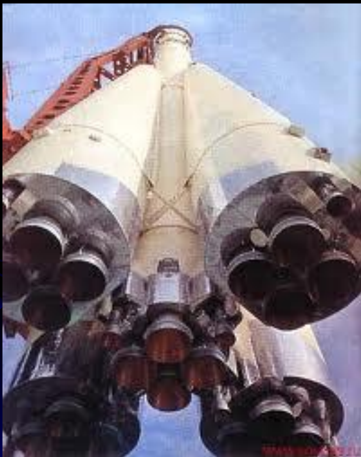
Ракета-носитель, на которой совершил полет Г.С. Титов