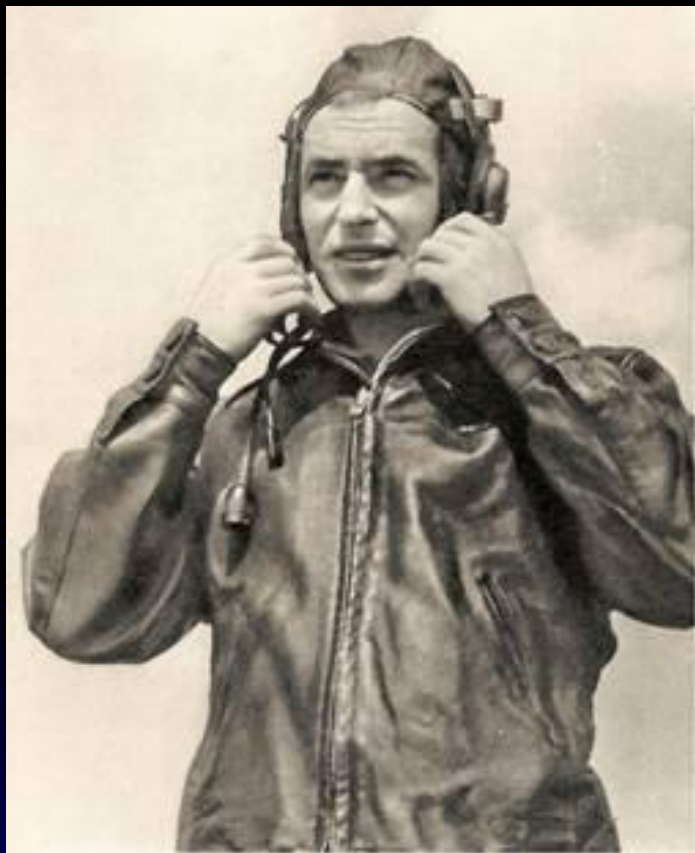
Г.С. Титов в Сиверской