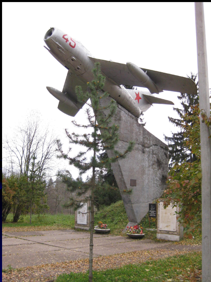
Мемориал «Защитникам Ленинградского неба»