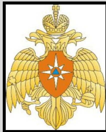
Большая эмблема МЧС России