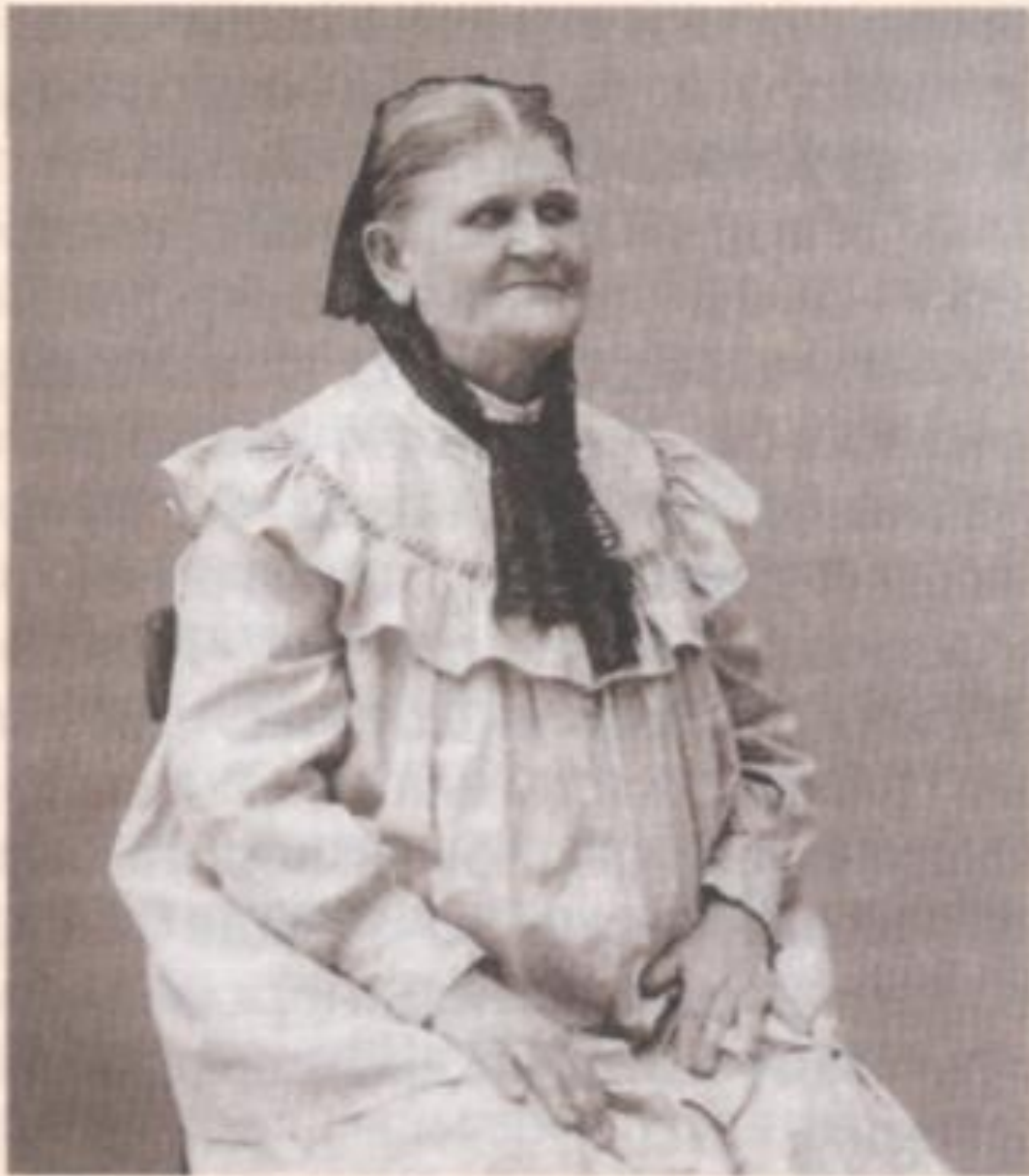
Ольга Осиповна Садовская.