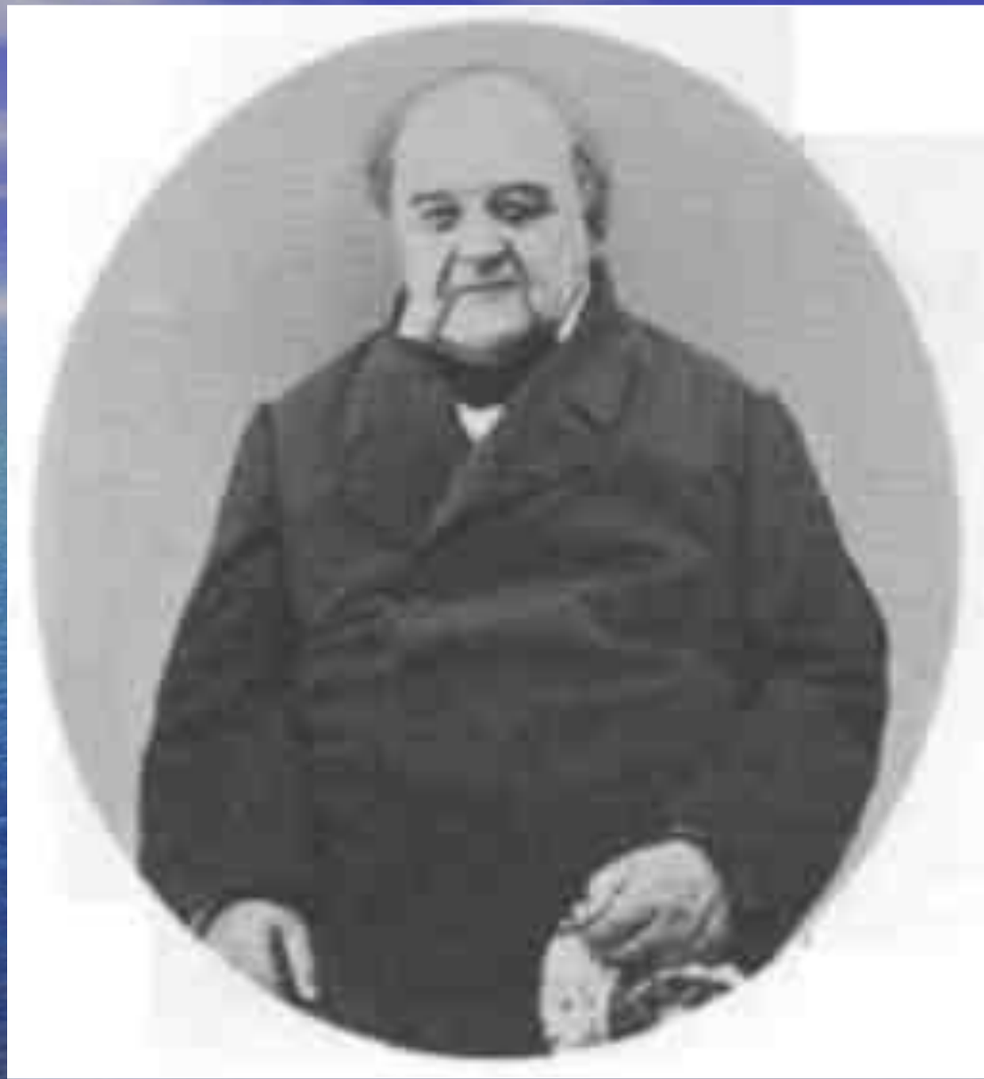
Михаил Семёнович Щепкин.