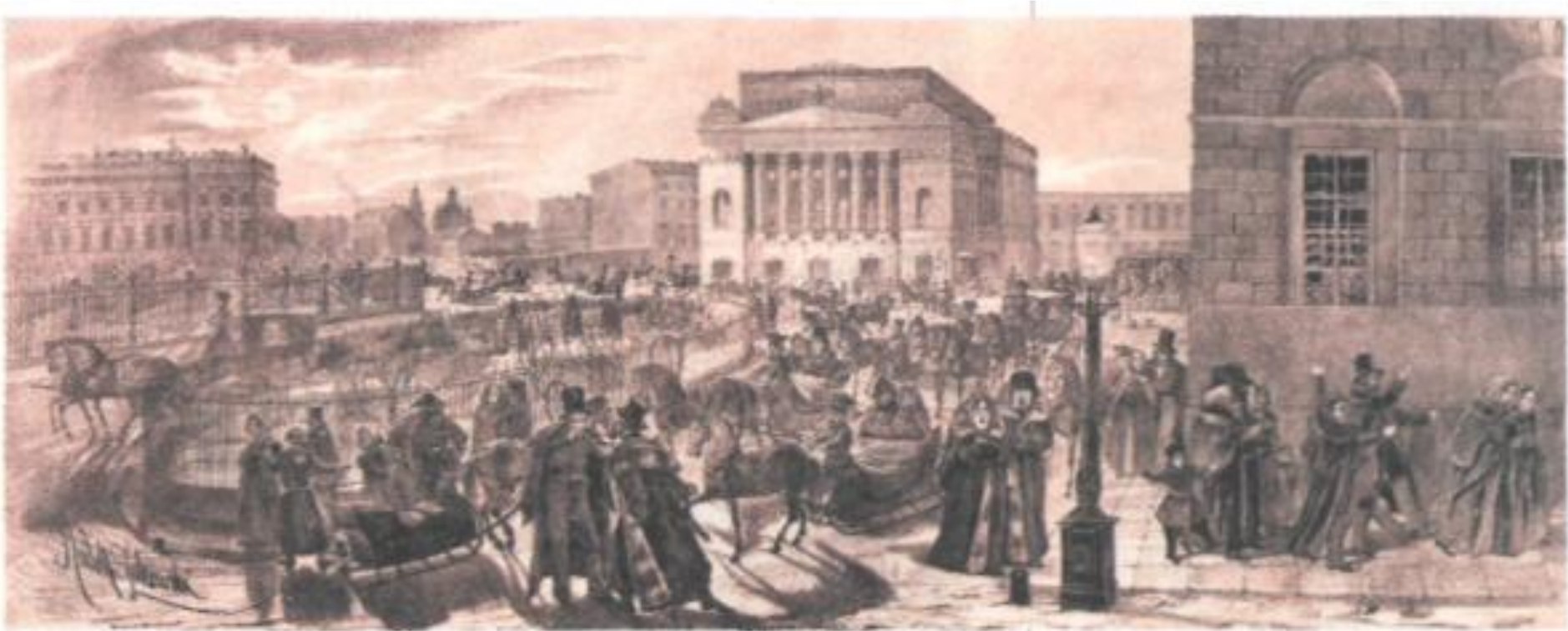
Разъезд зрителей из Александринского театра. Литография Р. Жуковского. 1824 г.