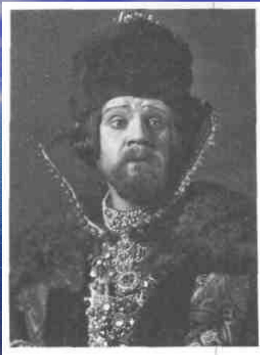
И.М. Москвин в роли царя Фёдора в спектакле «Царь Фёдор Иоаннович».