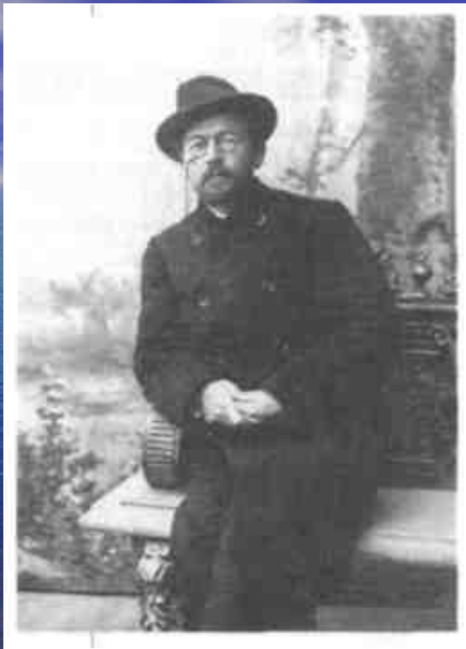
Антон Павлович Чехов. Фотография, подаренная Чеховым Станиславскому