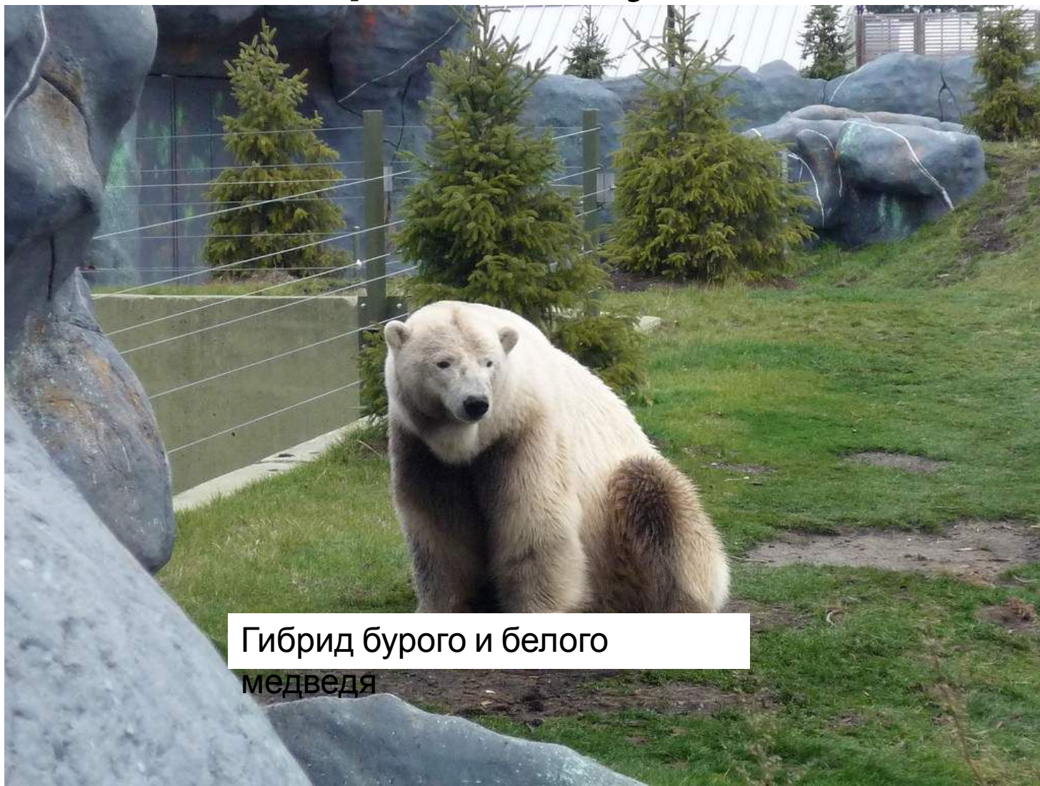
Гибрид бурого и белого медведя