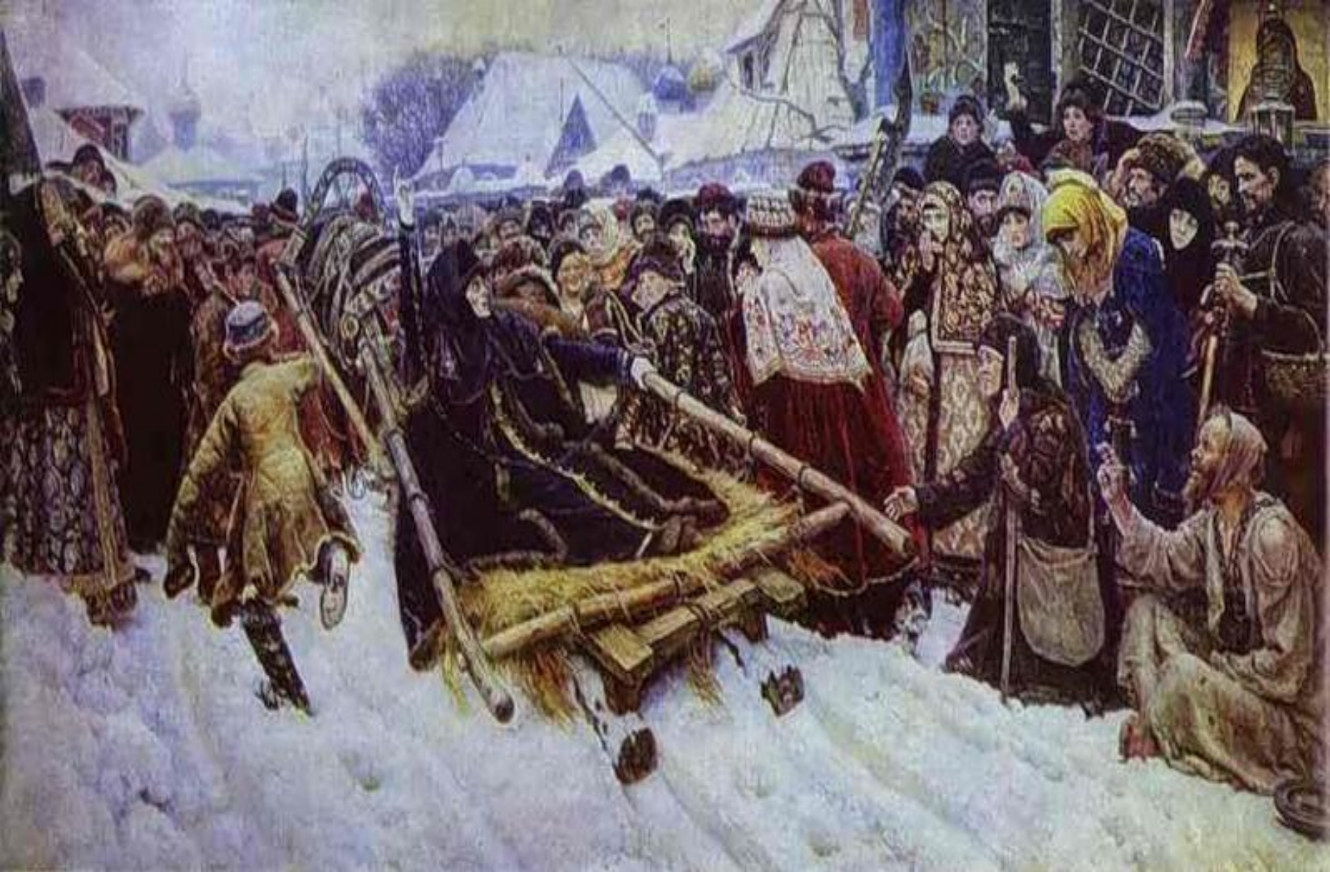
Суриков Боярыня Морозова