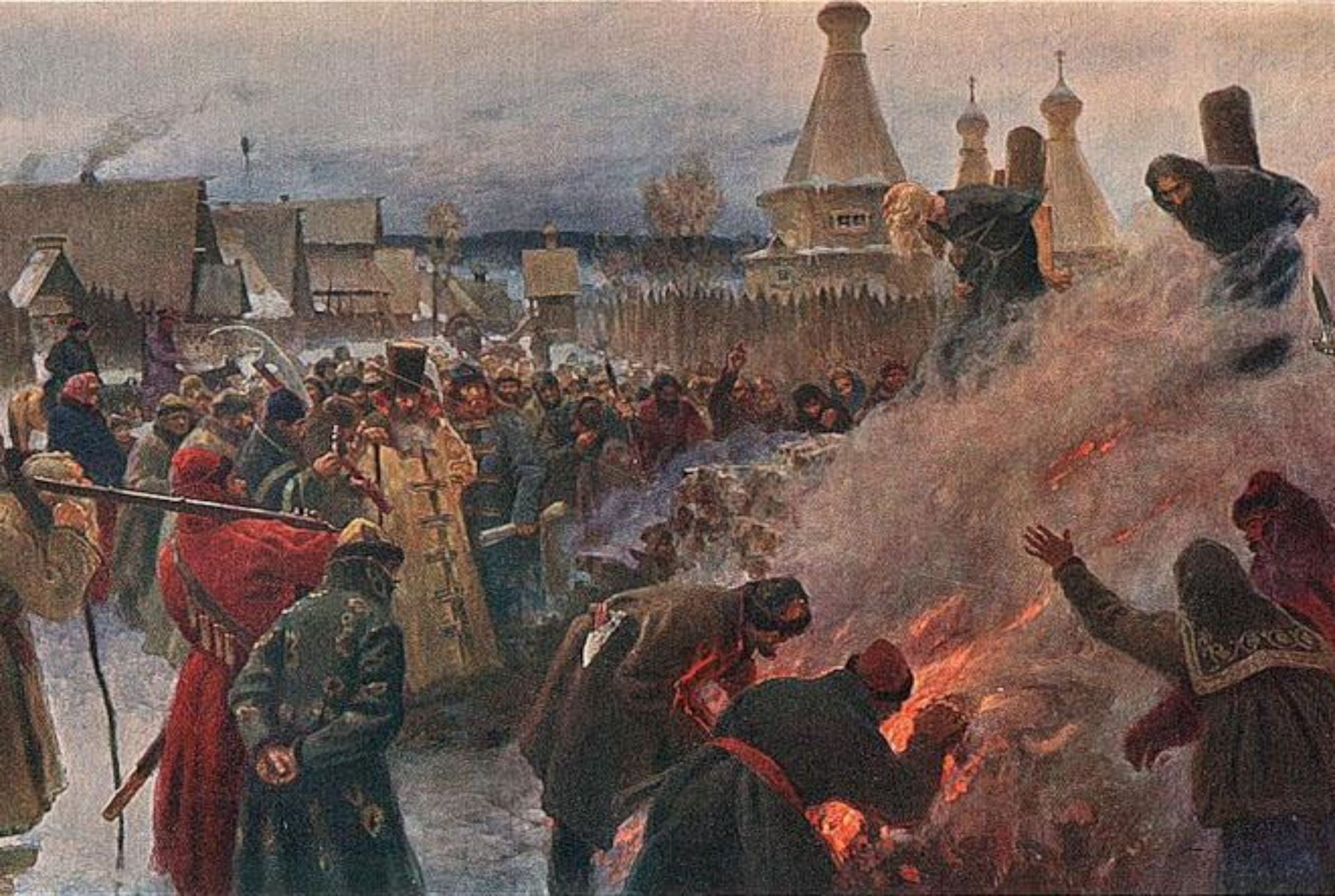
Сожжение протопопа Аввакума и других раскольников