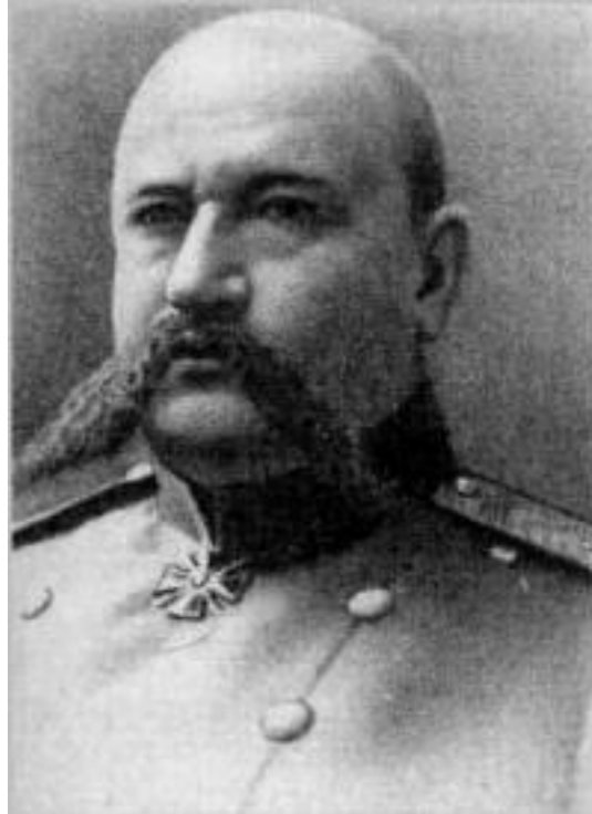
Юденич Николай Николаевич (1862 - 1933)