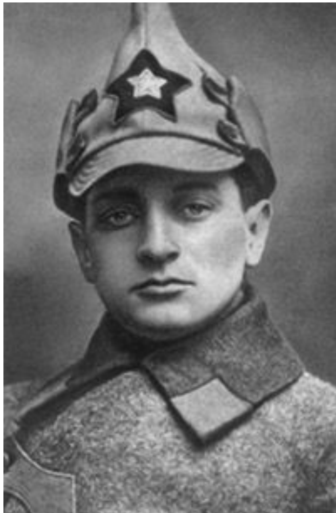
Тухачевский Михаил Николаевич (1893-1937)