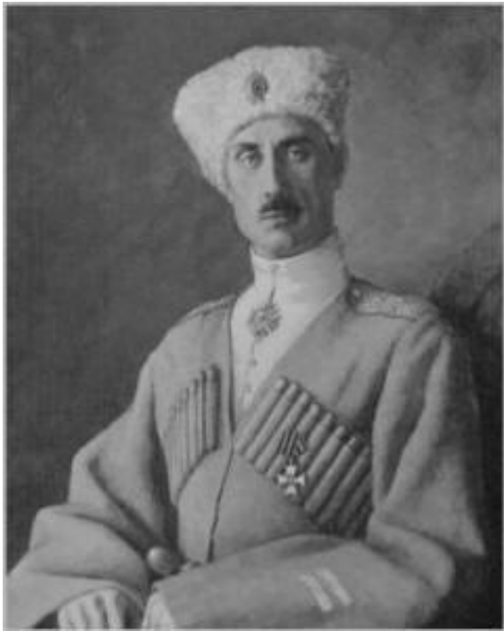
Врангель Петр Николаевич (1878-1928)