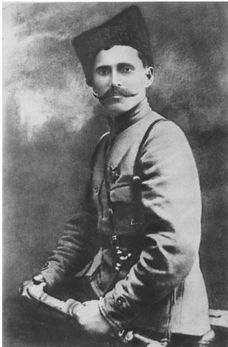
Чапаев Василий Иванович (1887-1919)