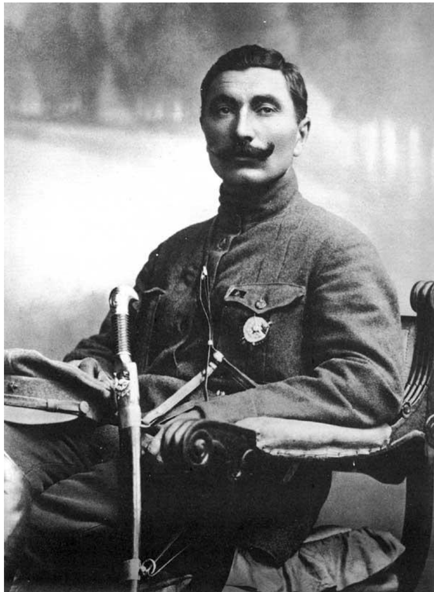
Буденный Семен Михайлович (1883-1973)