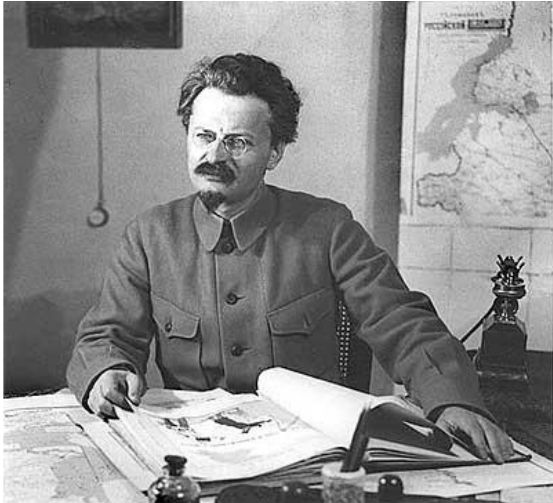
Троцкий Лев Давидович (1879-1940)