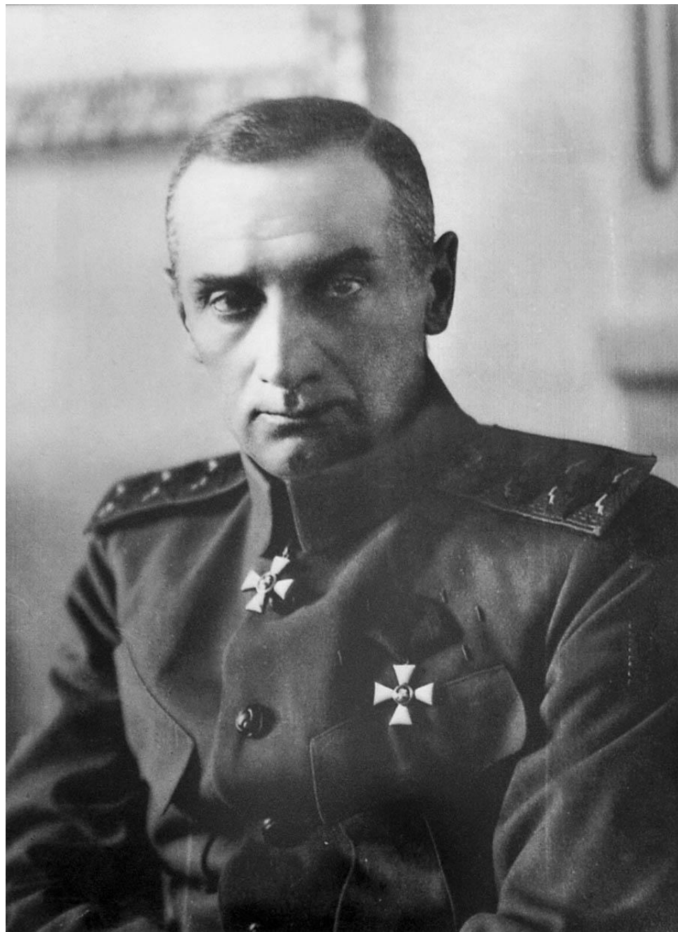
Колчак Александр Васильевич (1874 - 1920)