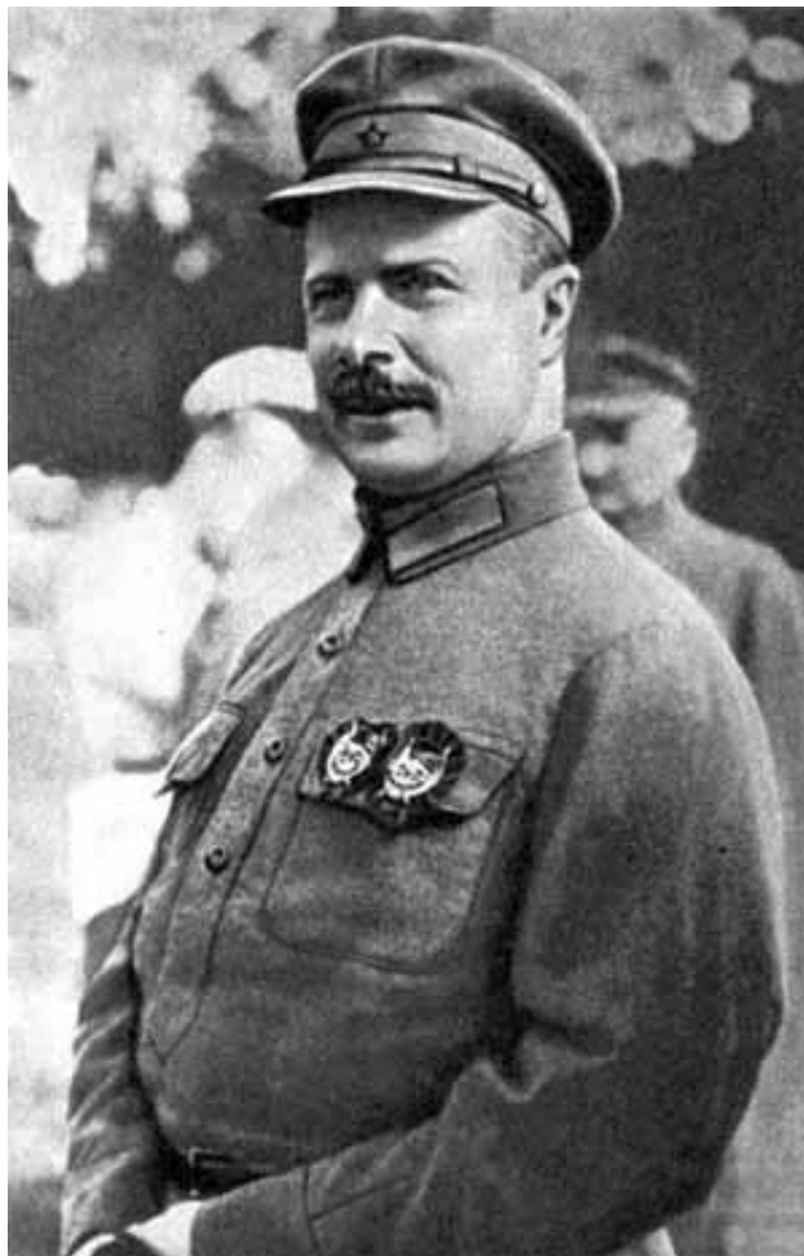
Фрунзе Михаил Васильевич (1885-1925)