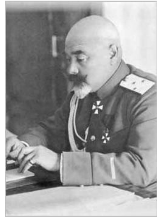
Деникин Антон Иванович (1872 - 1947)