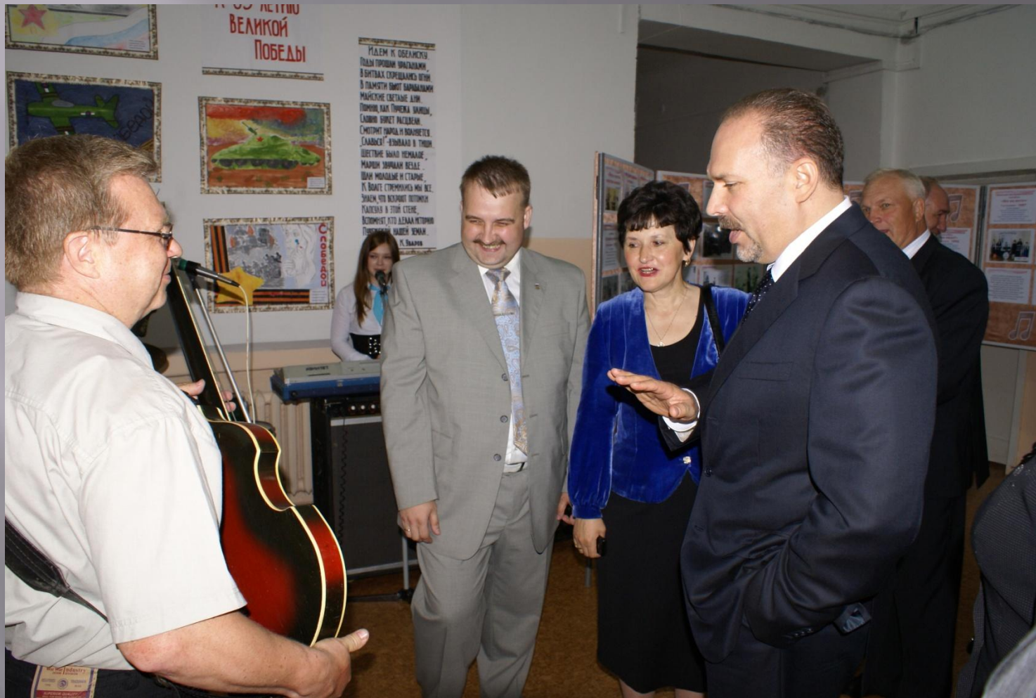
ВИА «Лицей» и губернатор Ивановской области Михаил Александрович Мень