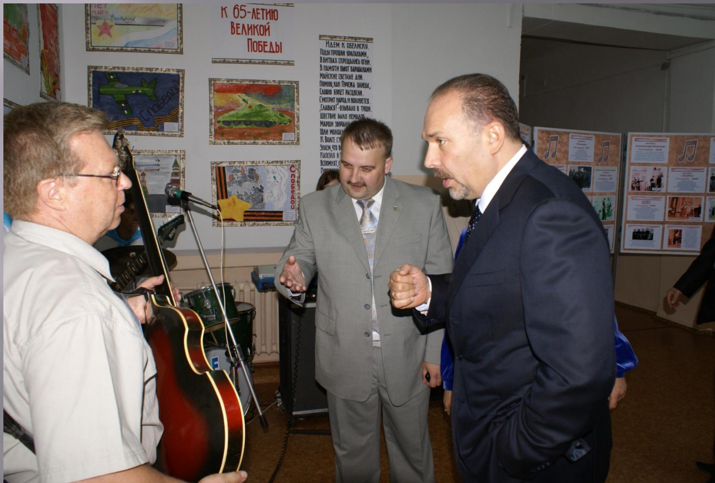
ВИА «Лицей» и губернатор Ивановской области Михаил Александрович Мень