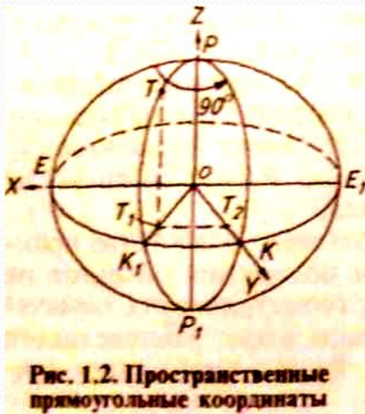
Рис. 1.2. Пространственные прямоугольные координаты