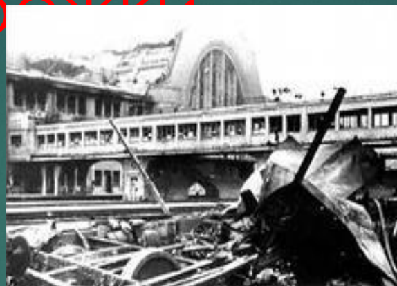
Здание вокзала в Киеве