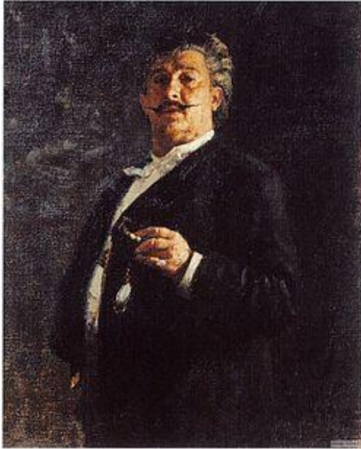
Скульптор: Михайло Микешин