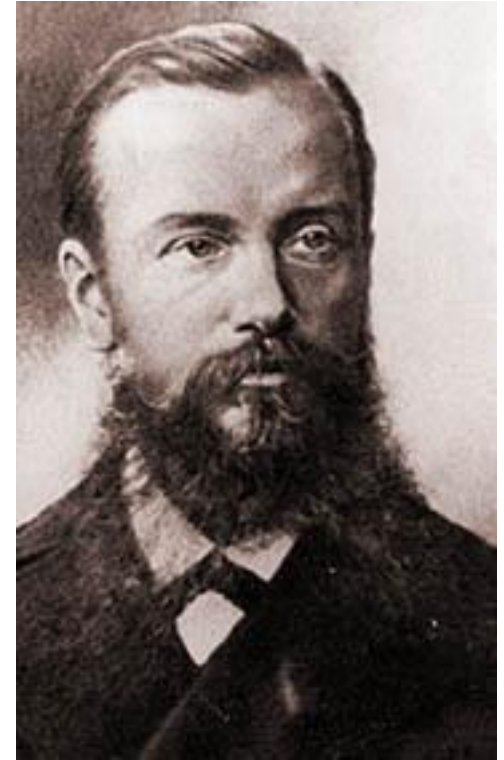
▣ Архітектор: Володимир Ніколаєв