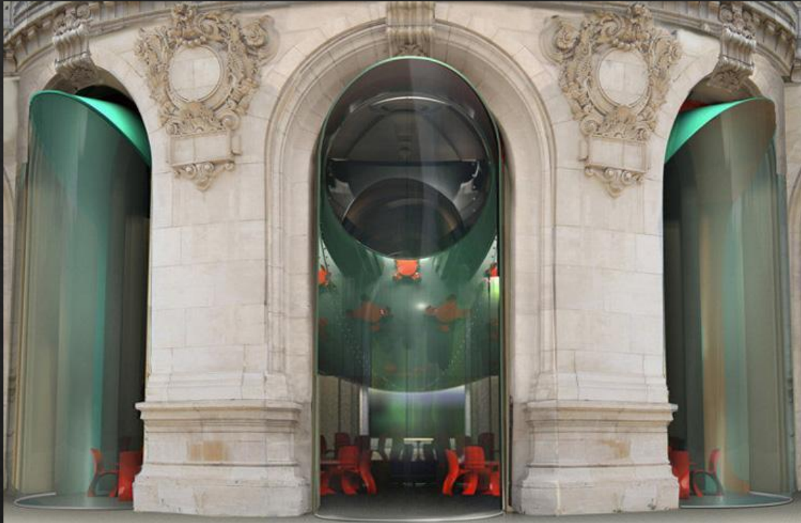
Ресторан Опера Garnier в Париже Рона Арада