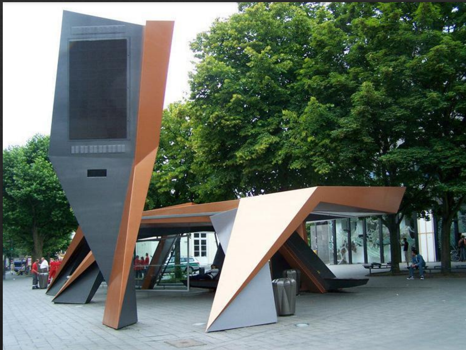
Автобусная остановка Питера Айзенмана