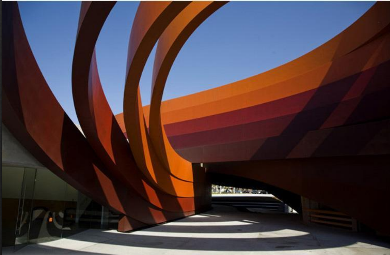
Design Museum Holon в Израиле Рона Арада