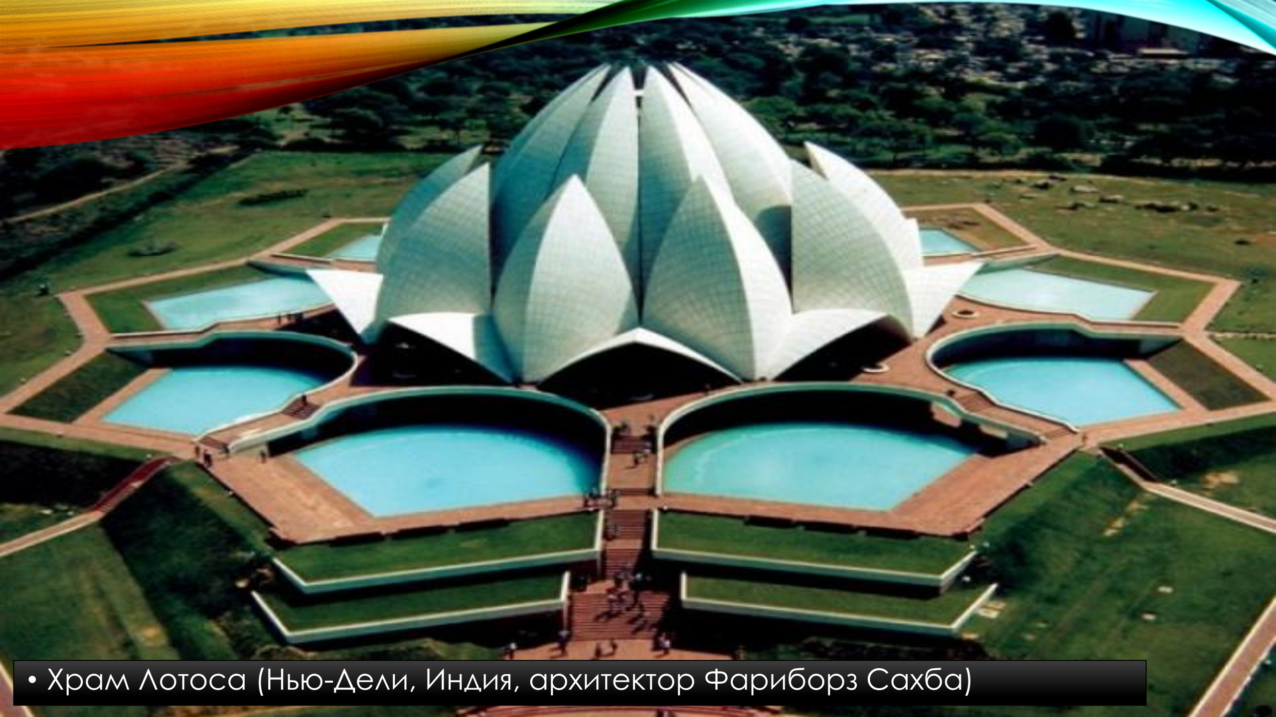
• Храм Лотоса (Нью-Дели, Индия, архитектор Фариборз Сахба)