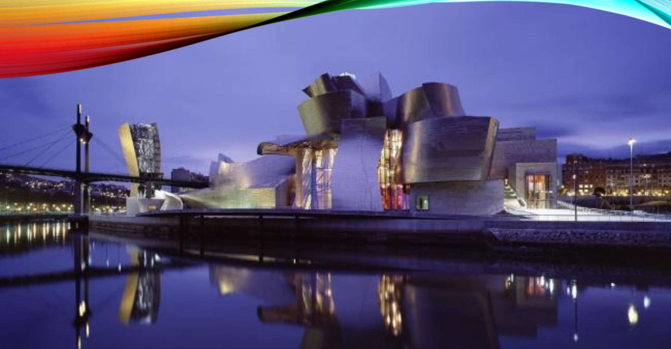
• Музей Гуггенхайма (Бильбао, Испания, архитектор Фрэнк Гери)