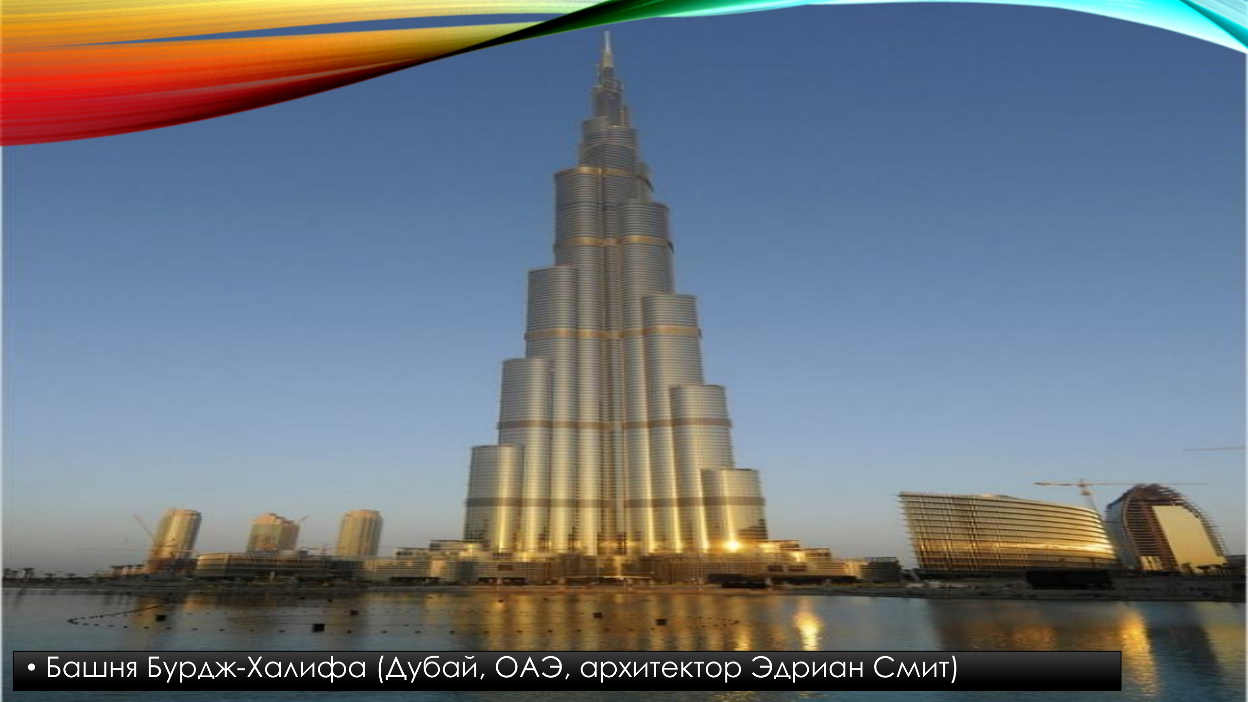
• Башня Бурдж-Халифа (Дубай, ОАЭ, архитектор Эдриан Смит)