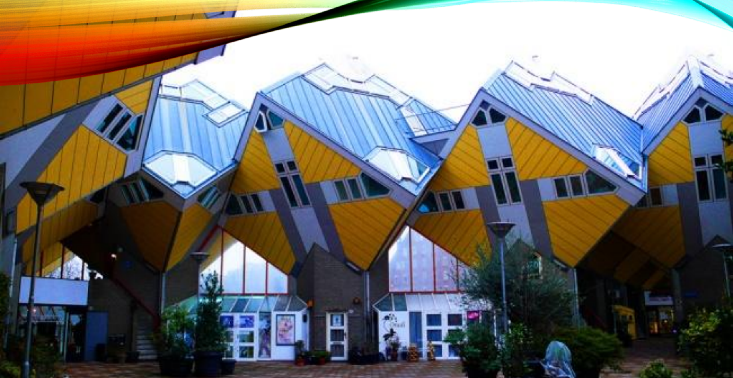
• Кубические дома (Роттердам, Нидерланды, архитектор Пит Блом)