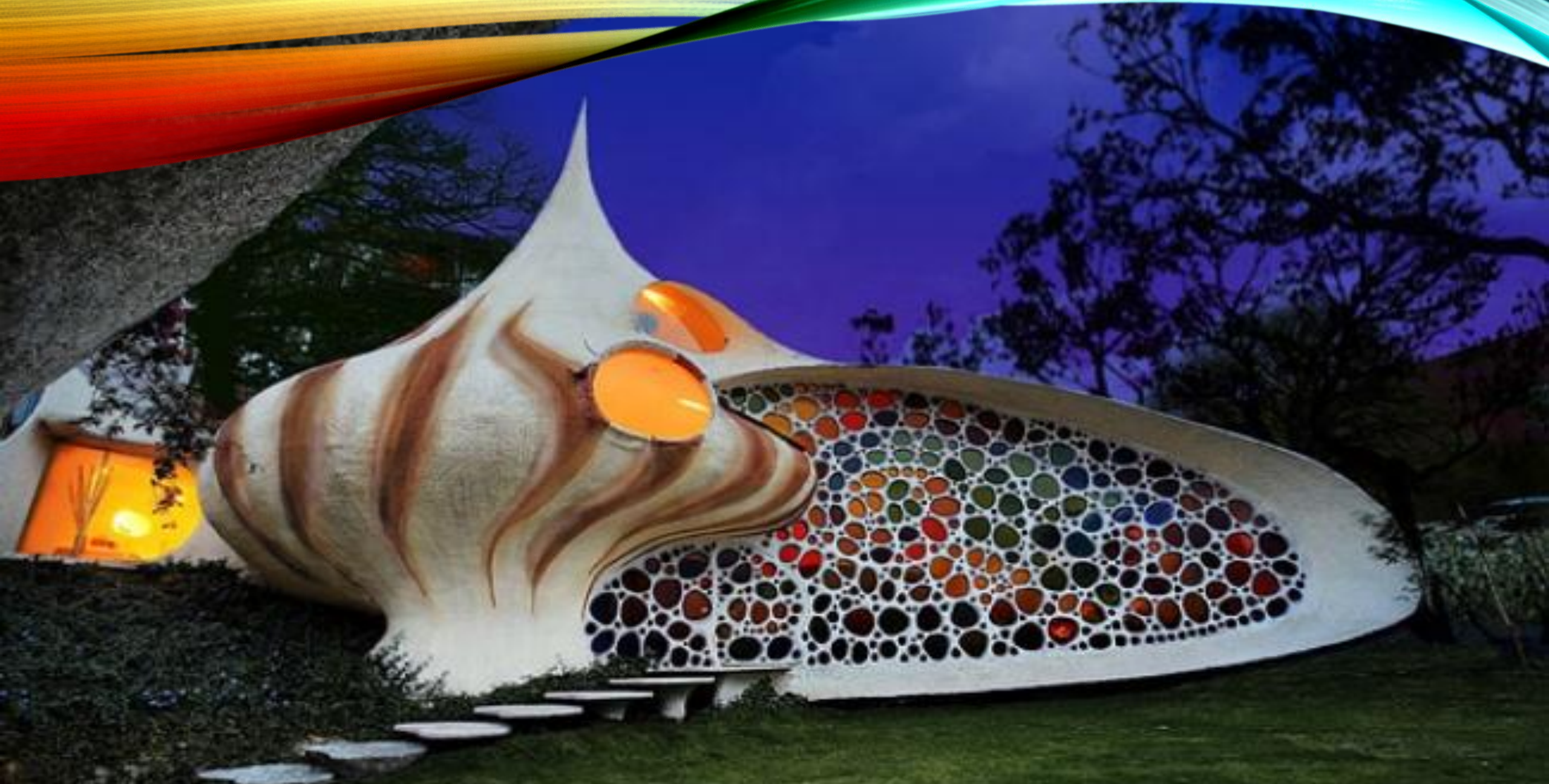
• Дом-ракушка «Наутилус» (Наукальпан, Мексика, архитектор Хавьер Сенсиан)