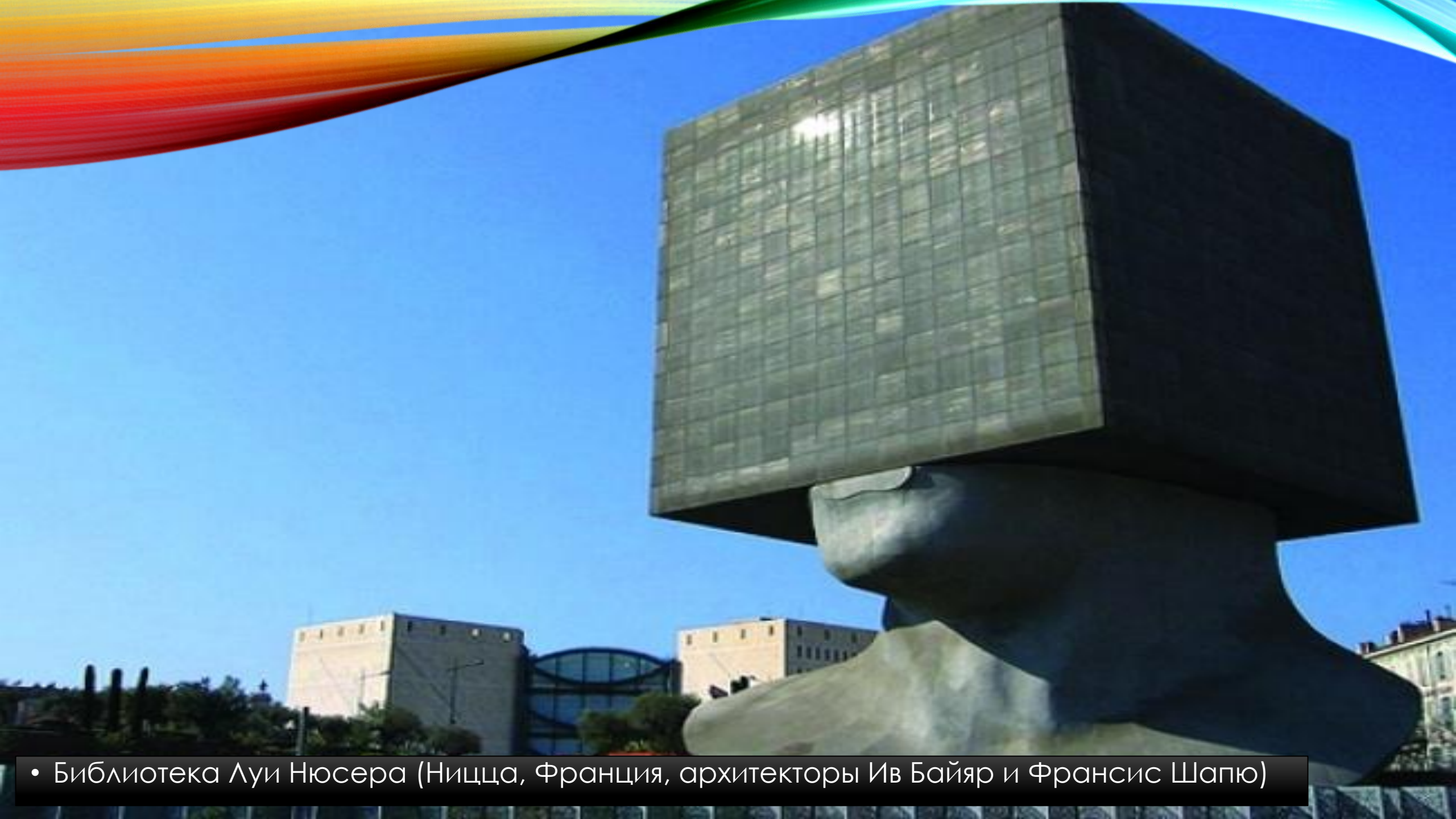
• Библиотека Луи Нюсера (Ницца, Франция, архитекторы Ив Байяр и Франсис Шапю)